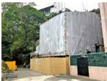
《我家》記者 3 月初前往，該廟正圍封維修。