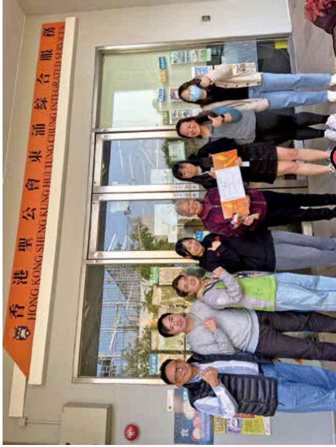
蕭婆婆參與「涌心·共建東涌情」計劃，由社區投資共享基金資助。