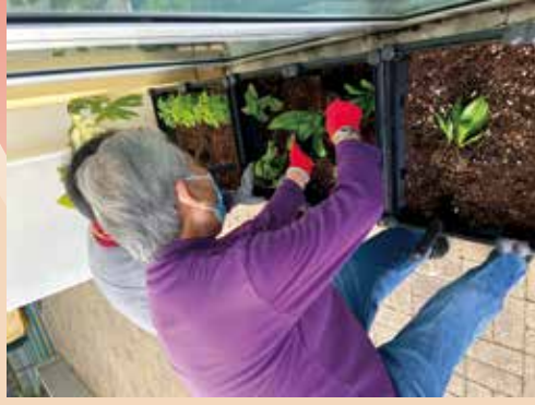
為附近幼稚園整理園圃。