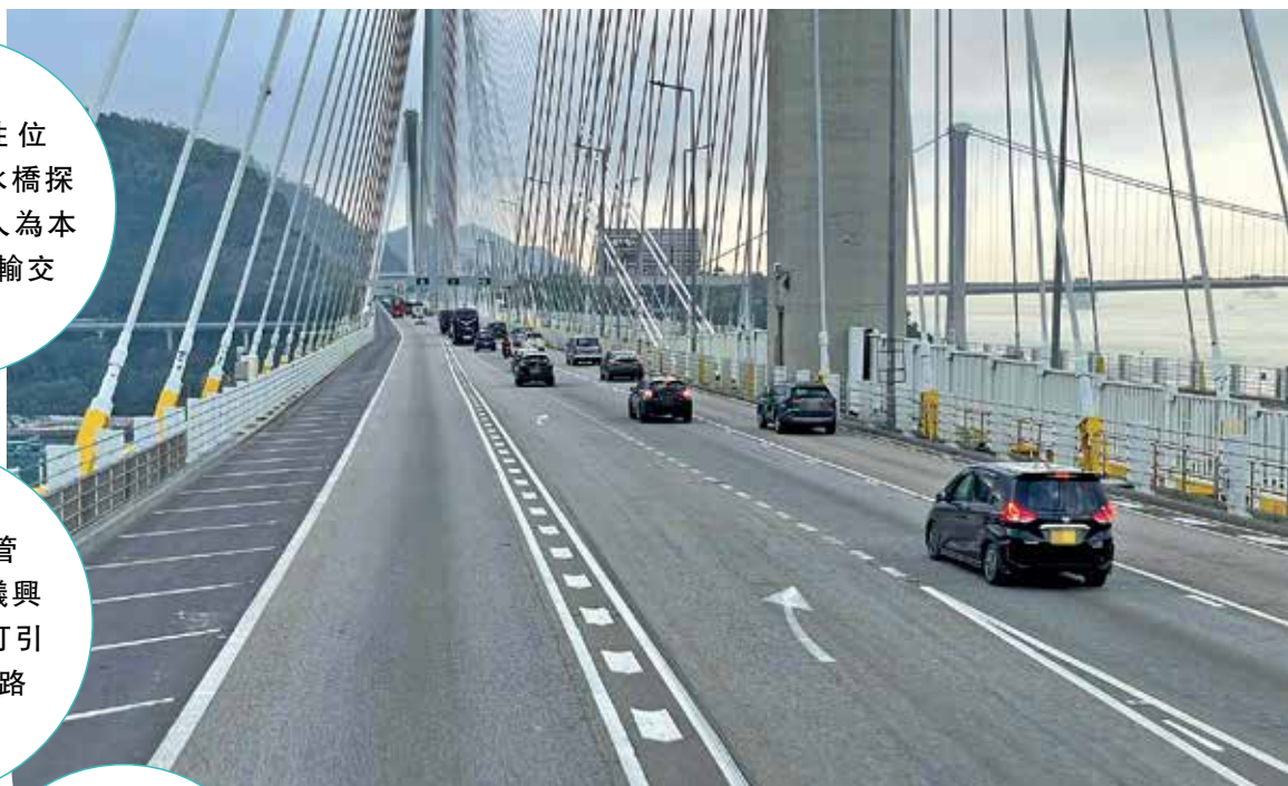
興建汀九橋時，雙向均預留兩條 3.6 米闊路肩。