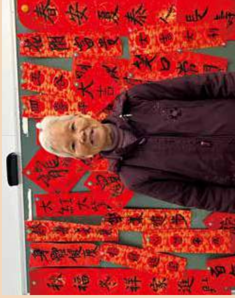
蕭婆婆認為做義工無年齡界限。