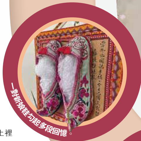
一對繡花鞋勾起多段回憶。