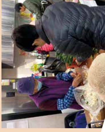
為獨居長者準備冬至飯。