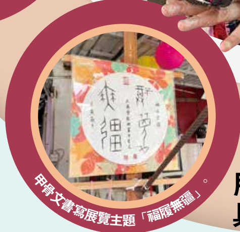
甲骨文書寫展覽主題「福履無疆」。