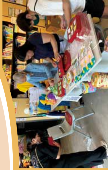
與年輕義工擺放好月餅等中秋物品。