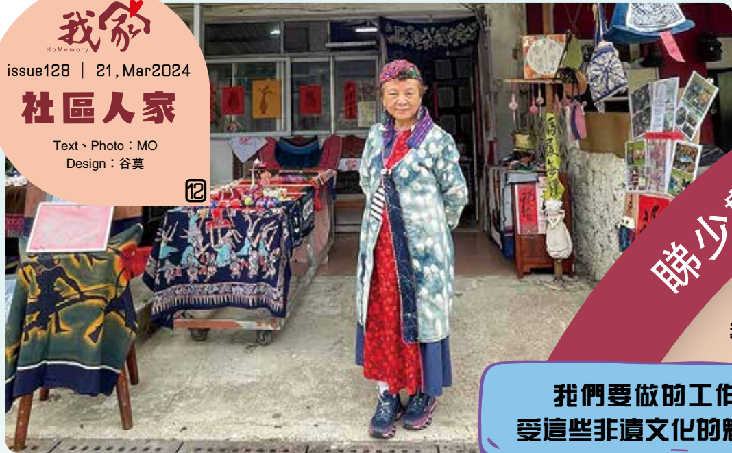
在坪洲小角落尋寶！