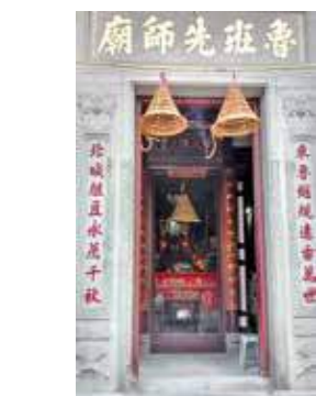
廟宇採三進兩院式布局。

時至今日，魯班先師廟正門除掛上「廣悅堂」三字的橫匾外，正門兩旁亦刻有對聯：「規矩常存，絕巧工而溯神聖」、「道器同貫，由格物以闡治平」。正殿內則供奉魯班先師神位，神龕上有「萬世流芳」四字。而廟內中歷史最悠久的文物是一塊立於光緒 10 年、刻有「倡建魯班先師廟簽題工金芳名碑誌」的石刻。