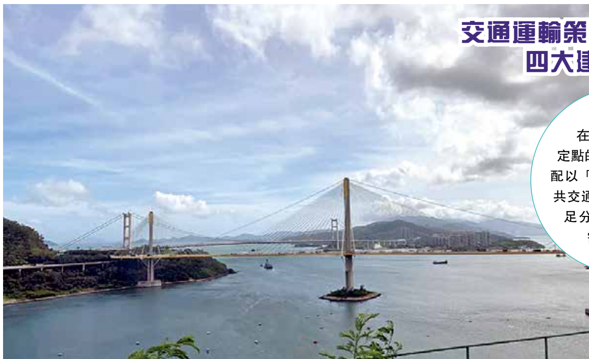
汀九橋南行線研推智慧公路先導計劃。