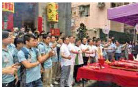
時至今日，建築業界仍前往膜拜。