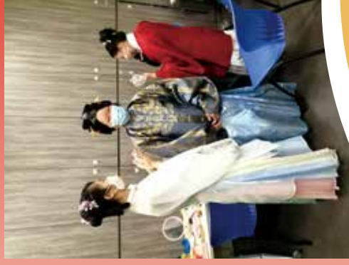
穿上漢服與青少年同樂。