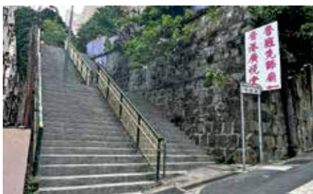
前往青蓮臺，遊人必須拾級而上。

魯班先師廟位於西環青蓮臺，周邊給綠樹及住宅包圍，環境恬靜。古諮會文件指廟宇採三進兩院式布局，建築精美，內存不少壁畫、石灣陶塑及泥塑等裝飾，以彩釉瓦片鋪設屋頂，其屋頂建築以 5 個形同山峰般的屋簷支撐，是名為「五岳朝天式」。設計甚為