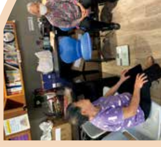
老友健康 陪接受 服務。

「我們區內有許多獨居的長者，非常需要他人的關懷……我自己煮了湯，得知一位獨居老人出