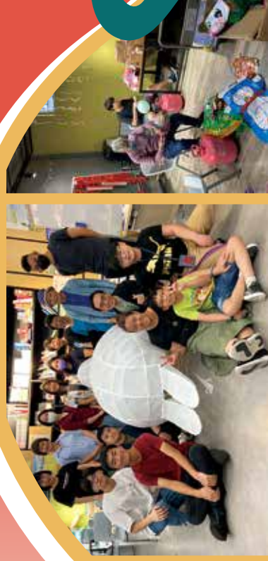
與青少年一同製作巨型月兔及氣球。