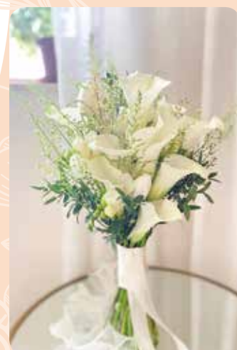
不同情感貫注花朵中，帶出不同意義。