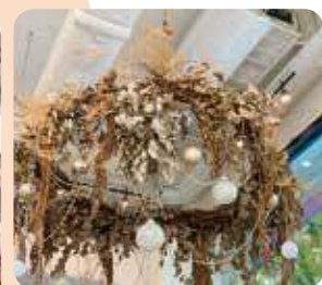
為咖啡館創作花藝裝飾。