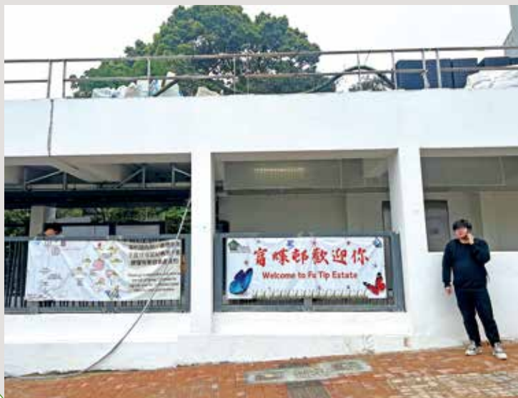
居民陸續收鎖匙，邨口掛上歡迎橫幅。