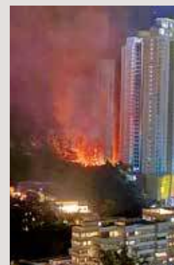
富蝶邨第二期地盤曾發生三級火。