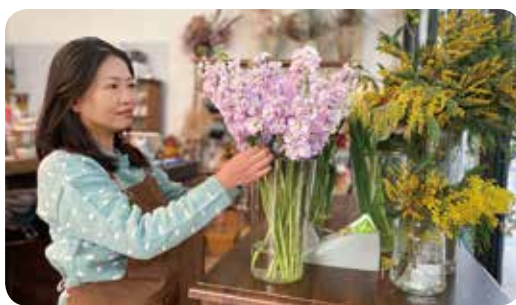
她說：「大埔係我好鍾意、好鍾意的地方。」

Jess 亦欣見男士用心思研究花束蘊藏的意義，「一對情侶相戀多年，男士決定在課室求婚，他和我研究很久，包括花語、顏色，見佢咁樣用心，我都會更加用心去做。」