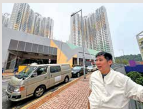
胡綽謙促署方開設臨時攤檔方便居民。