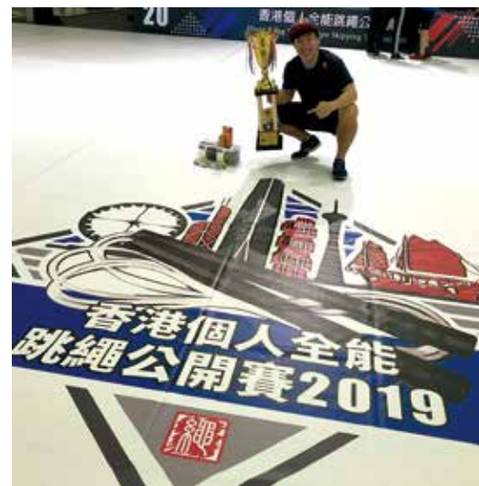
2019 那年，他已是寫下了世界紀錄的兩屆世冠。

網上選拔可無上限拍攝和剪接，沒有臨場心理壓力，他的發揮優勢因而收窄，儘管如此他仍堅持要突破自己，以積極心態面對順逆，追求無止境的進步，「跳到不能跳吧！」