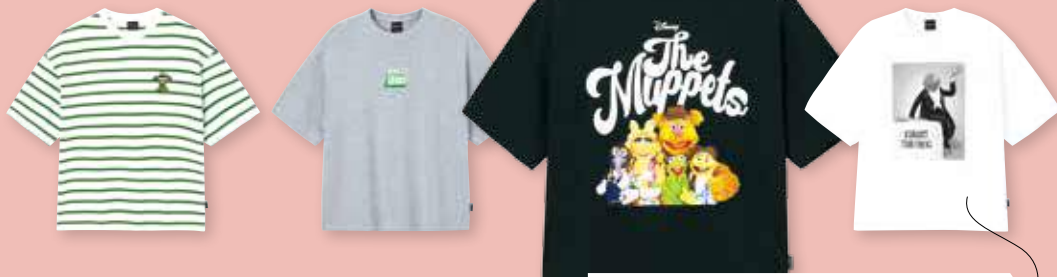
Wide Fit T-Shirt The Muppets 系列 (每件售價 HK $129)

《The MUPPETS》別注系列共有六款單品，當中出現頻率最高的當然是青蛙 Kermit。四款闊身剪裁潮 Tee 中，就有三款以青蛙 Kermit 作主題，分別為懷舊黑白 Photo Print、金句「Never say croak」和換上招牌綠色的法式橫間風味，而剩下一款則是《The MUPPETS》全家福圖案。