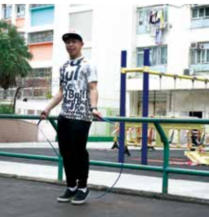
如果起動後先影相，可能只影到 Out Fo 的「無敵風火輪」。