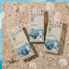
Kanebo 佳麗寶 ALLIE 持采 UV 高效防曬水凝乳 EX 限定設計款。

資生堂今年推出的全天候感光防曬護膚乳液，加入「螺旋藻能量精華」抵禦紫外線外，亦遵循《夏威夷州法律》的防曬產品，不含會造成珊瑚白化的「二苯甲酮」及「甲氧基肉桂酸辛酯」，讓大家擁抱太陽又愛護海洋。