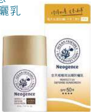
NEOGENE 全天候極效抗陽防曬乳。

適合從事水上活動或激烈運動使用，耐水、耐汗、抗摩擦，長效阻隔 UVA、UVB，可預防受到紫外線所導致的熱傷害。產品不含二苯甲酮與甲氧基肉桂酸辛酯兩種危害珊瑚的成分，更排除 11 種常見防曬添加劑及其他可能影響海洋生物成分，如小於 100nm 的奈米粒子、人工色料、香精與酒精。