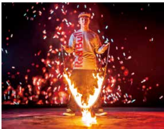
或為「瀟灑」添新意，「燒」的是繩，灑的是汗。