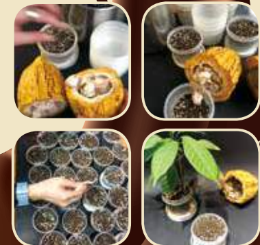
細味苦甜工藝，尾韻百味雜陳。