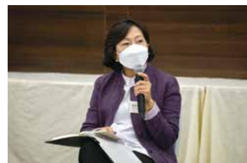
麥美娟表示，歡迎各界就關愛隊運作和架構提意見。

民政及青年事務局局長麥美娟回應指，政府一直透過青年發展委員會及其他地區平台與持份者聯繫，保持雙向交流。她解釋，政府有不少計劃在落實時都會與社會上的組織合作，包