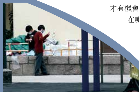
在訪問期間，碰巧有兩個學生到公園跳繩。