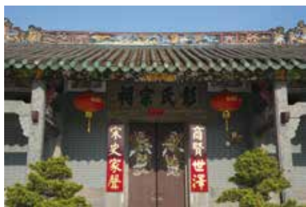
大門左右懸有楹聯。