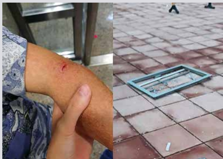
去年10月天頌苑鋁窗疑高處墮下，一老婦被碎片擊中受傷。

本月7日下午4時許，經民聯頌栢社區幹事陶竊訊，接獲一名獨居老人求助，指月初八號風球遲芭吹襲後，其單位窗戶愈見鬆動，閉窗時的間隙愈來愈大，因此自此不敢開窗，怕窗戶一打開時跌落街會弄傷人負上刑責。