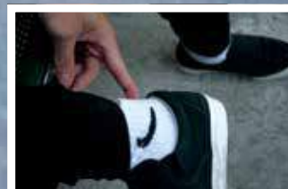
兩隻厚襪下，就是「繩」傷成對的紀錄。