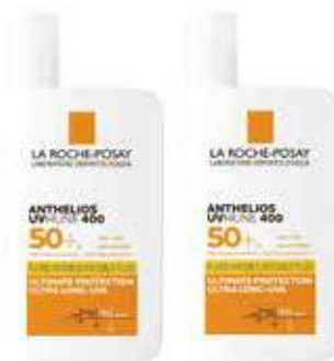
La Roche-Posay Anthelios UVMune 400 Invisible Fluid SPF50+ Sun Cream Duo。

理膚泉的專利「UVMUNE 400 防曬科技」可有效抵禦各種 UV 光波長，添加抗氧化維生素 E 與保濕溫泉水以達舒緩與修護的功效。「海洋友善配方」經過 7 種生態多樣性測試包含珊瑚、矽藻保護等，更不含有害環境的塑膠微粒。