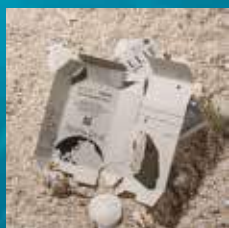
外包裝也可回收，紙盒的內襯可以再利用當成書籤或裝飾小物。