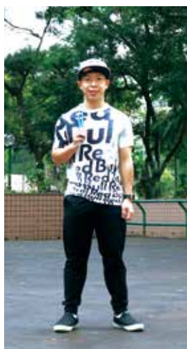
因為一「繩」不變，所以成功了！