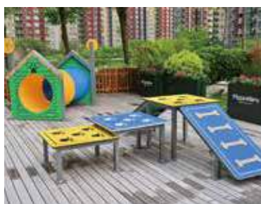
餐廳選址的 Yoho Mall 正舉辦「WILD-PET 週末市集」。

她期盼香港未來有更多寵物友善場所，讓毛小孩在成長的同時，也能夠讓主人參與更多毛孩的生活點滴。