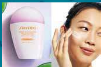
資生堂全天候感光防曬護膚乳液。

資生堂今年推出的全天候感光防曬護膚乳液，加入「螺旋藻能量精華」抵禦紫外線外，亦遵循《夏威夷州法律》的防曬產品，不含會造成珊瑚白化的「二苯甲酮」及「甲氧基肉桂酸辛酯」，讓大家擁抱太陽又愛護海洋。