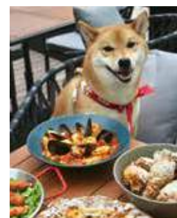
Maru Salon 旁邊開設餐廳，歡迎主人帶同寵物進餐，亦另備寵物鮮食餐點。