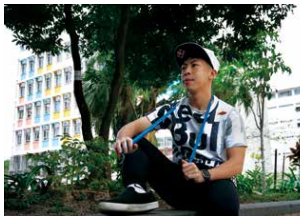
期盼再度突破自己，跳出個人最佳成績。