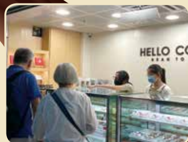
兩位小妮子，入得工場，出得舖面，得咗！