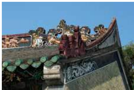
屋脊上有「鯉躍龍門」雕飾。