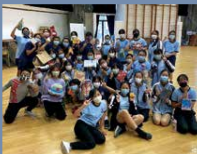
望將跳繩推廣成全民運動

他補充，有人會放工去打羽毛球、做瑜珈，但沒有人放工去跳繩，盼望有天能扭轉其他人對跳繩的既定形象，令更多人「入坑」。