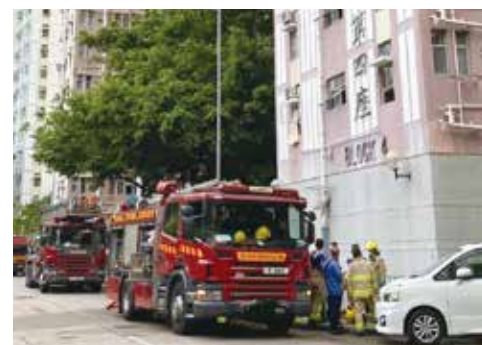
屯門寶田邨一單位，因雪櫃短路發生致命火警。

近期天氣炎熱，會導致雪櫃機組運行時間加長，若雪櫃散熱不良，會導致溫控器等機組損壞，一旦機組損壞有可能導致漏電及起火，並產生過高壓力而造成爆炸。