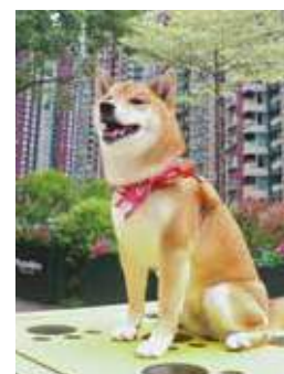
就像人類小孩子般在笑。