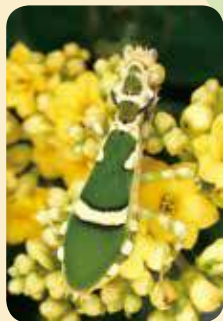
顏色之最，紋螳螂 Theopropus elegans 。