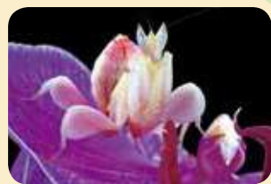
顏色之最，蘭花螳螂 Hymenopus coronatus 。