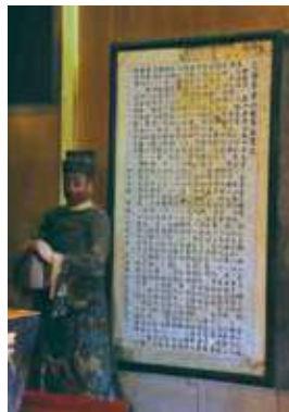
文昌帝君丹桂籍陰騭文。