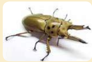
首度亮相，黃金鬼鍬形蟲 Allotopus rosenbergi 。