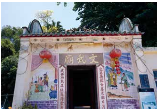
左右磁磚畫一文一武對仗。