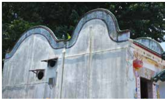
側面的山牆是波浪形狀。