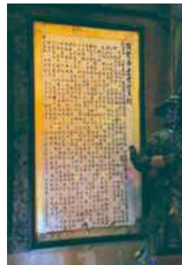
關聖帝君覺世真經。