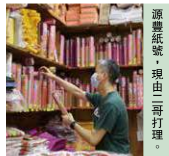
源豐紙號，現由二哥打理。

二哥有感而發：「有啲人好抗拒道教要燒衣燒香，我希望包容啲，尊重其他人嘅信仰，雖然燒香燒衣可能會造成煙灰，有人會好嫌棄，其實過程只係好短暫。」不同信仰都有不同儀式，應給予尊重和接納，傳承傳統文化，建造共融的社會。