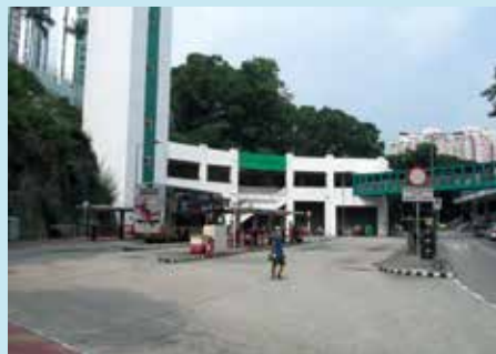
荃威花園巴士站，是不少長者常到的總站。