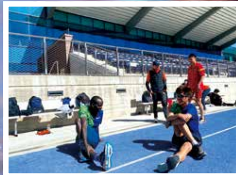
赴美參賽，打破塵封11年的香港紀錄。