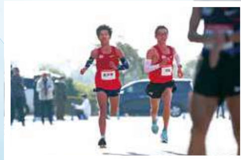
在美國跑半馬賽的終點位置。