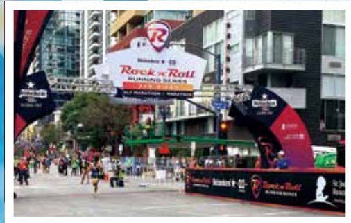
藉比賽認識各地的人，擴闊社交圈。