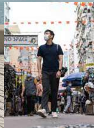
有時帶著相機，認識地區人和事。

例如第五波疫情初期，他負責全港社區抗疫連線的安老院舍派送物資工作，會先與團隊率先了解院舍需求，再精準安排物資，確保物盡其用，「他們急需防護力高的口罩及保護衣，反而普通口罩就過剩」。他認為，政府在地區開展義工網絡時，可參考這些經驗，先向地區組織及人士「摸底」，認清區情自然事半功倍。