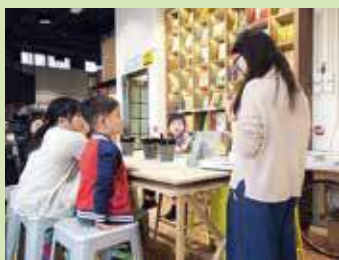
閱讀繪本祭及創意環保玩具工作坊。