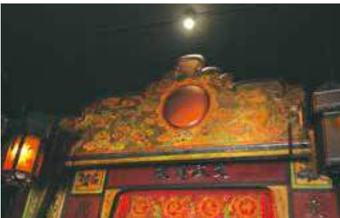
擋中上有「澤及萬方」的牌匾。