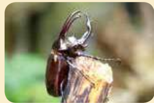
體型之最，阿特拉斯南洋大兜蟲 Chalcosoma atlas 。