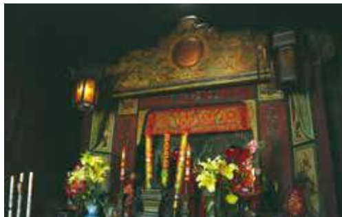
精緻的主神龕「文武寶殿」內端居文武二帝。