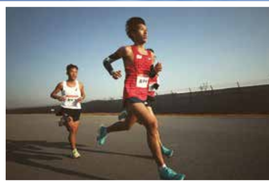
尋求理想，始終達到。