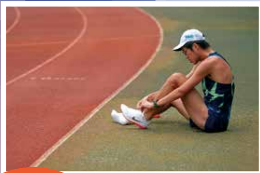
練習同樣獲得滿足感。