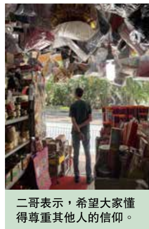
二哥表示，希望大家懂得尊重其他人的信仰。