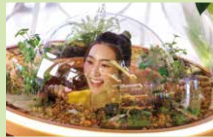
將軍澳中心與香港甲蟲研究協會合作，於即日起至9月21日舉辦「甲蟲王國大冒險」主題活動。