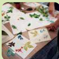
農莊導賞團及環保工作坊及升級再造小手作工作坊。