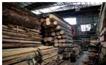
志記鏢木廠位於新發展區範圍內，收地限期屆滿需要遷出。

劉國勳批評，政府一直強調「基建先行」，古洞站規劃早於落馬洲線時已預留，惟竟拖至今年才正式刊憲，反映「基建先行」只是口號。他擔心日後古洞陸續入伙後，將來日後人流仍會集中於現時在繁忙時間已飽和的港鐵東鐵綫，認為政府最重要是盡快興建南北鐵路，以作分流。