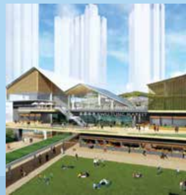
未來古洞港鐵站旁，將興建新公眾街市。（概念圖）

環境及生態局指新街市其中兩層將會興建綠化花園，三樓更設有一個多用途空間，預留舉辦街市推廣及節慶活動，而部分近地下入口的攤檔會採用面向街道的設計，以增街市吸引力。另外，街市未來將設有蓋走廊連接港鐵古洞站，亦會直接連接公營租