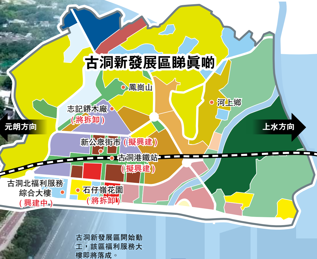
古洞新發展區開始動工，該區福利服務大樓即將落成。