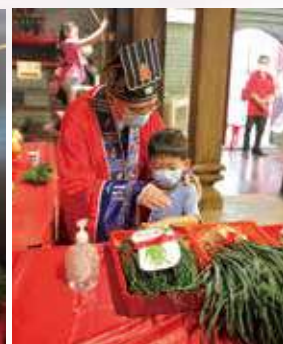
毛筆、葱及芹菜，寓意聰明勤奮。