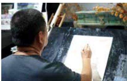
希望把失去的時間拿回來。