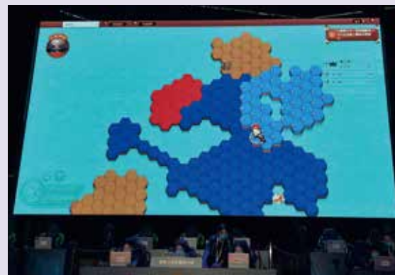
參賽者鬥智鬥勇，一邊答問題一邊拓領土，刺激！