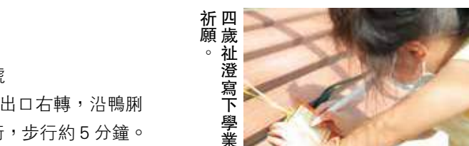
四歲祉澄寫下學業祈願。