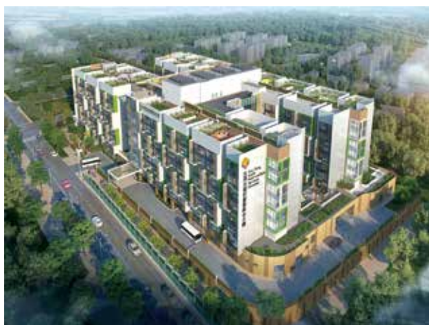
石仔嶺花園安老院院友，將安排入住福利服務大樓。 (概念圖)