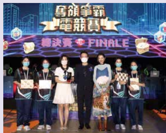
掌握「知識」「團結」兩種力量，自然有加乘效應而奪冠。