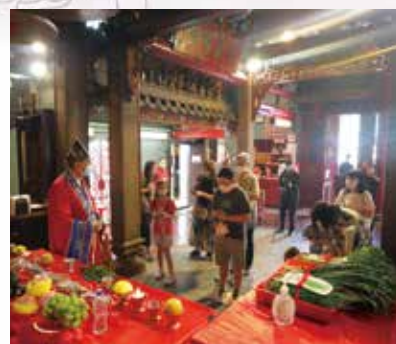
學子們向文昌帝君鞠躬行禮。