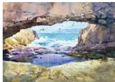
2021 在香港「天涯海角」寫生的作品：《鶴咀》