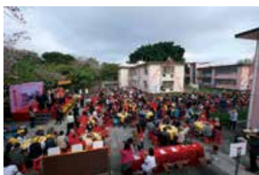
石仔嶺花園搬遷後的土地，將用於房屋發展。