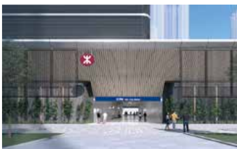
古洞港鐵站預計將於 2027 年落成。 (概念圖)