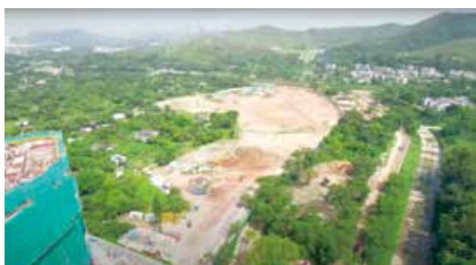
首階段發展土地，正進行前期工程及平整。