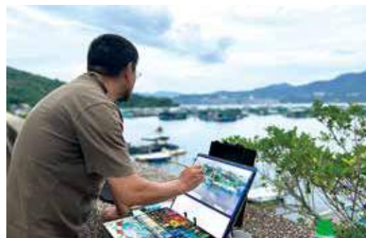
2022 在三門仔魚棚寫生的作品：《水上人家》