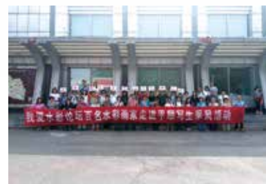
山西太行採風，畫出人文風彩。

於是，他帶領學生一起到內地寫生，「我們去到了山西的山溝裡，寫生也就和當地人有了接觸，知道老人現在有政府的補助，生活有了改善，了解到內地農村現在的模樣。」回憶起寫生的經歷，他還時常回想起從村民誠樸的笑臉，感受到真實的幸福，「20年山西的朋友告訴我，他們已完成所有縣的貧困清零，歡迎我們再次去寫生。」