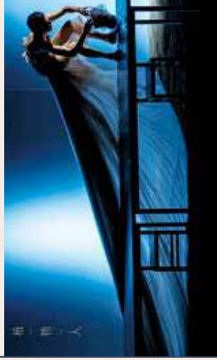
觀眾看到的服裝「面」，源自小洪的「線」。