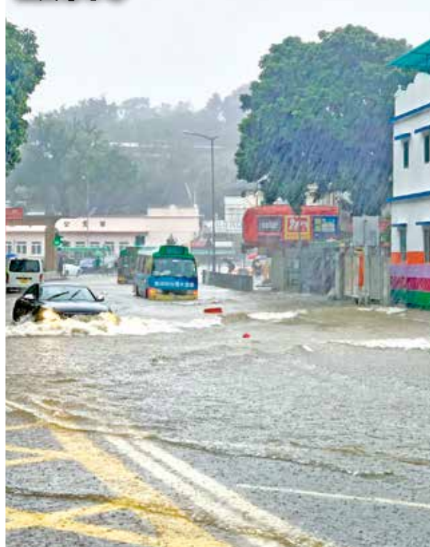
西貢市中心紅雨時有車輛死火。