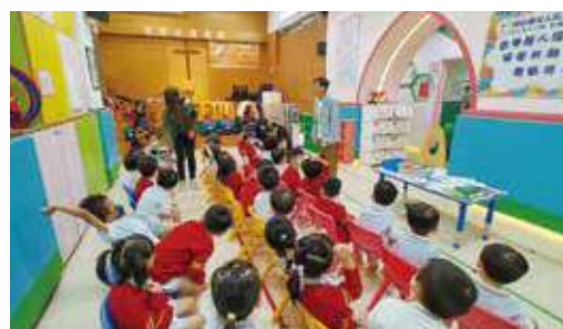
不時到學校分享個人經歷。

雖然整體社會對聽障人士接受度高，但阿堂坦承持續包容不容易，期望社會能理解和接納，尤其是校園氣氛，「老師的支援比任何科技都重要」，讓聽障學生感受到關懷。