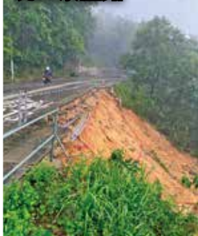
坑口大面積山泥傾瀉，來回行車線一度封閉。