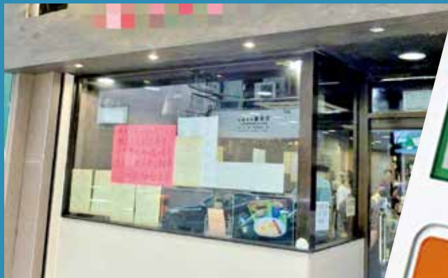
涉事餐廳事後已移除加收手續費告示。