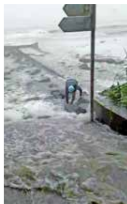
紅雨時有泳客險被洪水沖走。