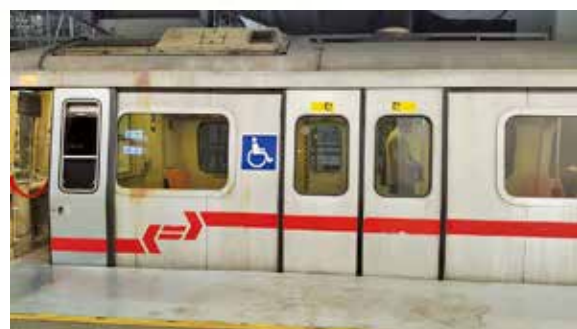
「黃頭」多年來泊在火炭車廠。