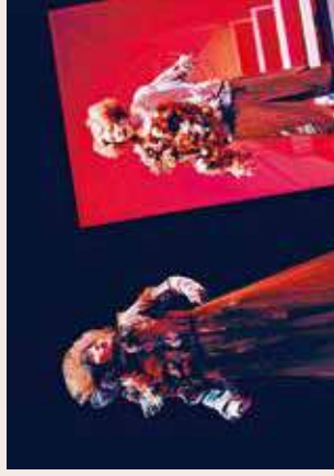
小洪認為戲服能更刻劃角色的形象。