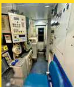
退役列車駕駛室開放市民參觀。