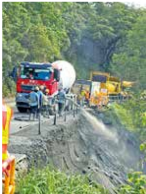
土力工程處委託承辦商緊急加固山體。