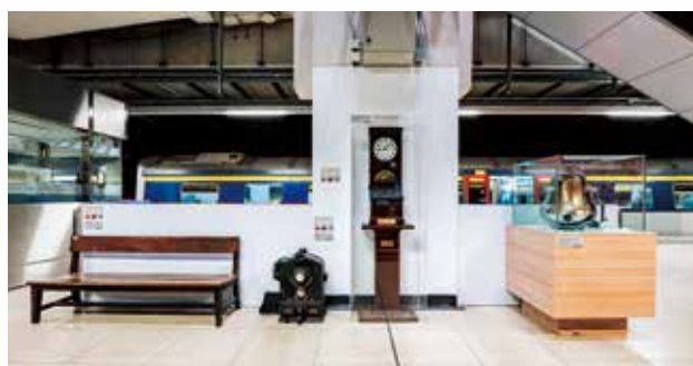
鐵路展「活化」紅磡站舊月台。

東鐵線過海段通車後，紅磡站的月台重新劃線，舊紅磡站月台閒置多時。港鐵近月將舊月台重新布置成鐵路體驗館，旨在讓市民懷緬舊日的時光，甫開始已大受歡迎。當中，1999年「榮休」的第一代電氣化列車「黃頭」堪稱主角，因為今次是該三卡退役列車，25年來首度公開展出。