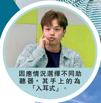
因應情況選擇不同助聽器，其手上的為「入耳式」。