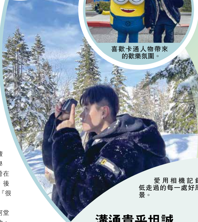
愛用相機記錄低走過的每一處好風景。