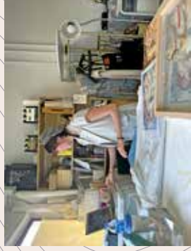
數月前進駐中大埔藝術中心工作室。