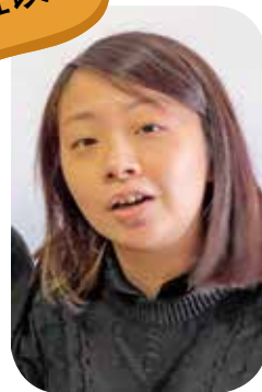
李小姐對八達通機收取商戶手續費有所保留。

「我們的八達通機和其他支付工具分開兩部機安裝，八達通安裝的機器拍卡時間相對較長，而且隔着銀包拍卡會感應不到，以我所知有其他商店都因而取消八達通收費，如果要收手續費應先改善並做好配套。其實八達通已用按金及增值費另作資本投資賺取利潤，不收取手續費其實都有錢賺。」