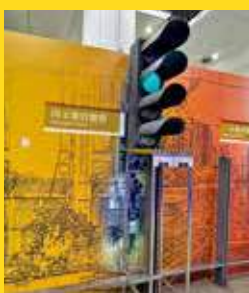
「鐵路解碼」展區介紹信號燈。