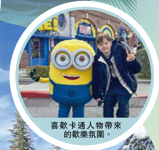
喜歡卡通人物帶來的歡樂氛圍。