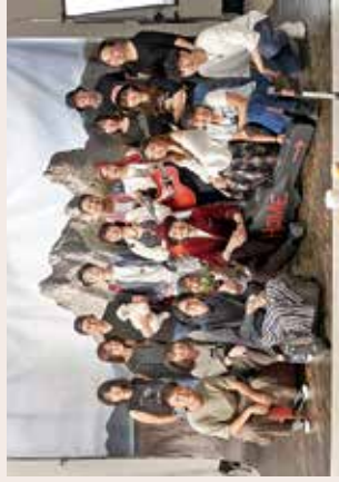
將才華貢獻給一個又一個演出。