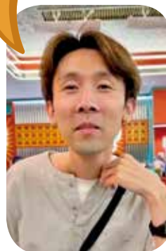
盧先生認為安裝八達通可方便客人。