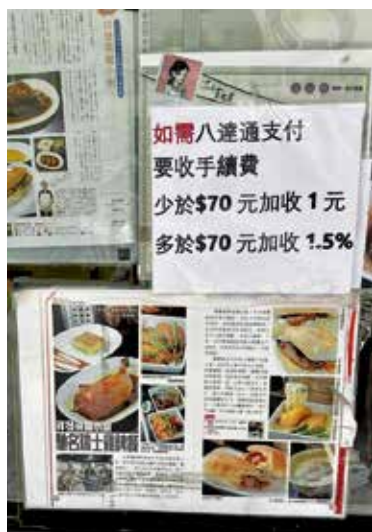
北角有餐廳早前加收收八達通支付手續費。

有網民認為八達通公司本身會向食店收取按帳單收取手續費，因此食店向食客事先張揚會收取費用可理解；惟亦有食客認為食店是變相加價並不合理，店家不能把營運成本轉嫁食客。