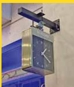
「站見」可見昔日雷達鐘。