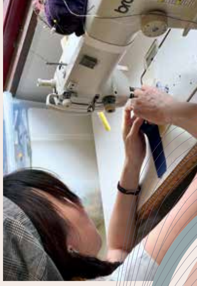
認真考量每個細節，希望演員穿得舒適而發揮更佳。