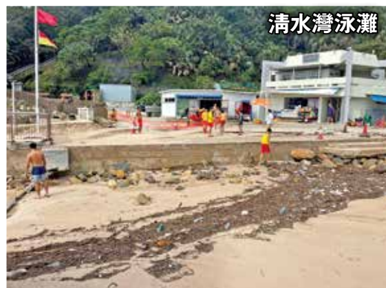
清水灣二灘海沙被沖塌流失。