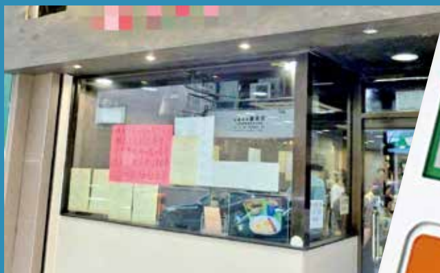
涉事餐廳事後已移除加收手續費告示。