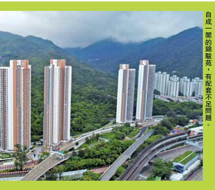
自成一閩的錦駿苑，有配套不足問題。