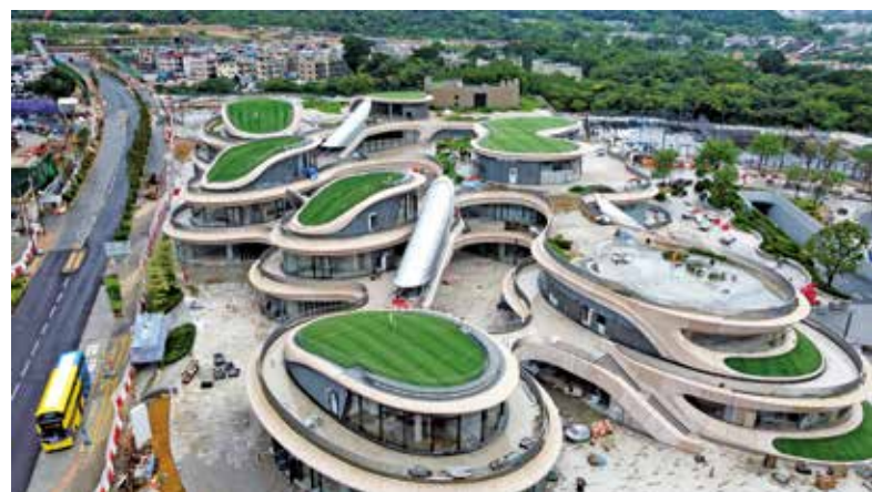
十四鄉新發展商場料今年稍後啓用。