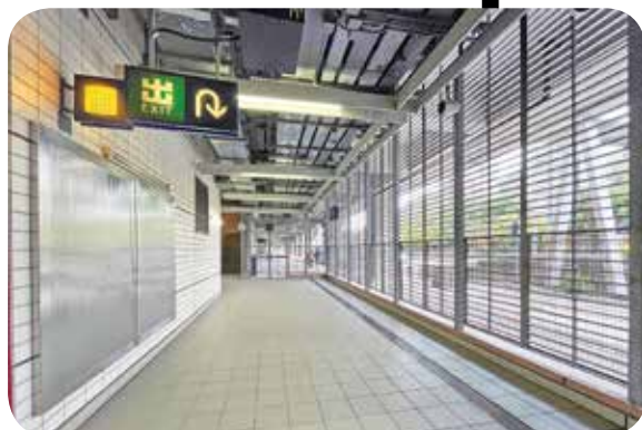
大水坑站預留位置可增建出口。

運輸署發言人回應指，會繼續與港鐵公司保持緊密聯絡，並督促港鐵公司密切留意乘客出行模式的變化，按實際需要，適時調整車站設施及相關安排，以配合乘客需要。