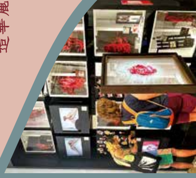
小洪十分珍惜每次與觀眾的互動。

每件作品都是小洪用心製作的，但最令她感到滿足的，是之前為郵輪表演設計以四季為主題的戲服，「設計中使用水晶呈現冰雪效果，用產生共鳴的物料，營造華麗的感覺」。