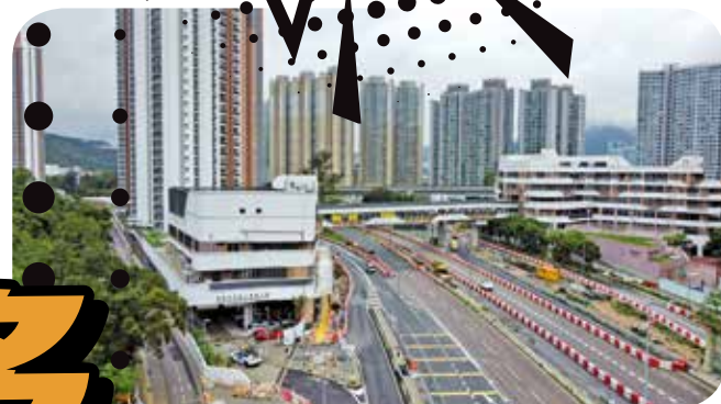
錦駿苑與欣安商場第二期靠行人橋接駁。