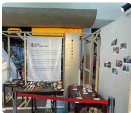
商場辦陶藝展，讓學員感受創作之樂趣。

你有多久沒試過 和屋企人一起坐下來，一起 做一件事，然後慢慢感受居住在 家中的溫暖？有團體以藝術體驗作為 媒介，鼓勵照顧者與長者在共同創作陶 泥，早前更在沙田秦石商場展出作品，讓社 區感受這班銀齡人士的才華！