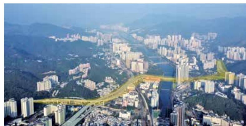
T4主幹路撥款申請獲立法會通過。(構想圖)

另外，馬鞍山來往大學站必經的大老山公路T6橋，正計劃擴闊工程，當中包括增建往九龍方向支路。T6橋的擴建，將可疏導馬鞍山前往大學及大埔日益增加的車流。