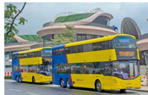
新巴士線581及287號會途徑馬鞍山。

公布的《香港主要運輸基建發展藍圖》內，這意味當局至今未有將該提議，納入2046年及以後的策略性鐵路計劃內。