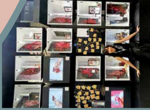
在布拉格展示的作品《心靈謀殺》。