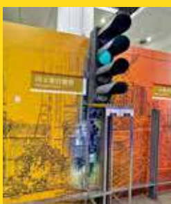
「鐵路解碼」展區介紹信號燈。