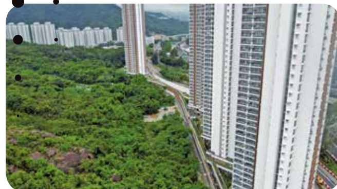
另一邊單位面向山邊，踏入雨季受蠓患困擾。