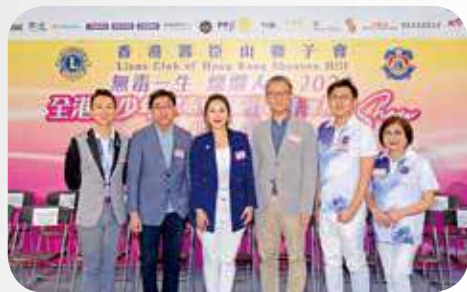
大會倡導無毒校園的健康生活，並邀高永文（左二）、蕭澤頤（右三）等出席主禮。