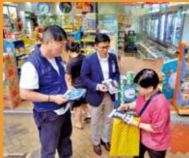
警方與區議員一同宣傳反爆竊。