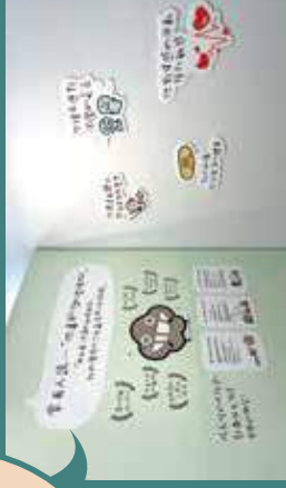
Rap 透露正製作地圖，介紹塵舍 5 分鐘路程內吃玩好去處。