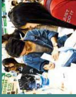
是塵世間一樂事。書寫友誼促進交流，