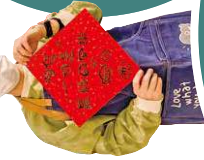
創業累積了寶貴經驗。昔日塞翁失馬焉知非福。