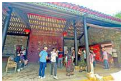
電影熱潮吸引遊客到訪寨城公園。

而在清拆城寨時，考古團隊經老居民指引，在南門遺址挖掘出刻有「南門」及「九龍寨城」的花崗岩石額，相信是居民二戰時知道日軍入侵而埋藏於泥土下。