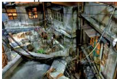
電影重塑城寨的場景。