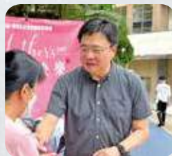
立法會議員陳沛良：

「嚴格執行的士司機違例記分制，可以回應社會對改善的士服務，以及就的士司機的不當行爲和罪行提高罰則的強烈訴求。在新例下，可以讓屢犯不改的司機停牌加強阻嚇。另外的士亦應以立法方式強制所有的士安裝車輛攝錄器，認為可在短期內提升的士營運、安全和服務，減少的士交通意外。」