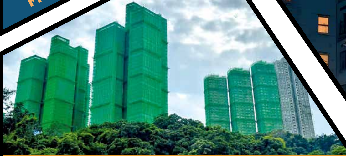
火炭穗禾苑大維修期間，發生至少四宗連環爆竊。