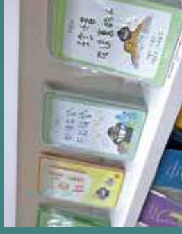
當文字者看到「發揮萬物」。

Rap 說，那些思前想後，旁人以為微不足道，其實當時很想有人說教、安慰自己。「語錄是寫給自己的，也留一個空間給讀者自己解讀，沒有一個很清晰的情況，跟大家說應該做什麼。」Rap 希望無論什麼身分、職業、性別，正面對任何困境，讀者都能代入成為「塵」的朋友。「用心寫的文字比起黃金更有價值。」