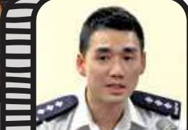
香子健指涉住宅罪案數字有上升趨勢。