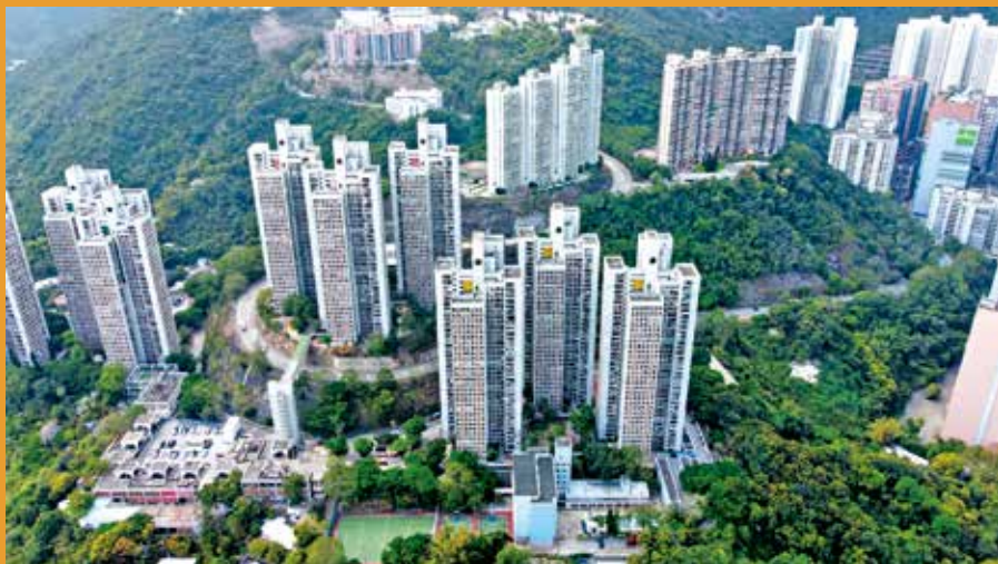
警方指穗禾苑4月起多次發生爆竊。

其後，經翻查閉路電視及情報分析，鎖定第二名男子身份，並隨即將其通緝。至同日下午約3時，該名男子嘗試經羅湖口岸潛逃內地時，最終被警方拘捕。兩人其後被落案起訴各一項「入屋犯法罪」。