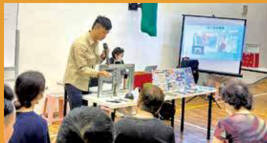
警方為居民安排防盜講座。