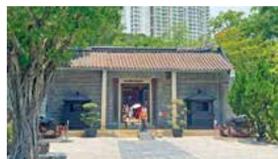
公園內保存1847年所建的清朝衙門建築。