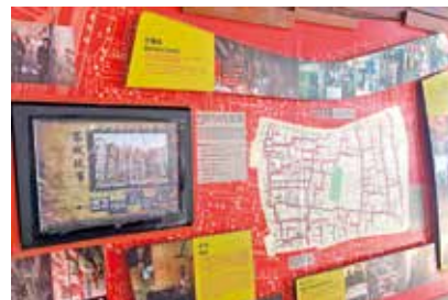
衙門內展出城寨清拆前的地圖及影片。