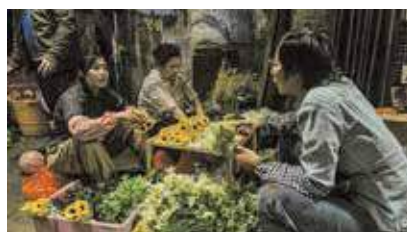
電影美術總監指希望高度還原實景。(《九龍城寨之圍城》電影劇照)