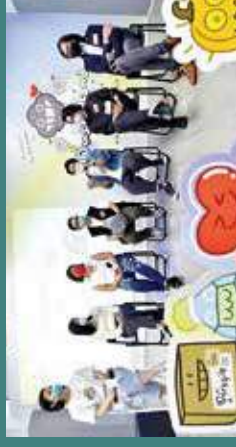
出席座談會分享創作經驗。