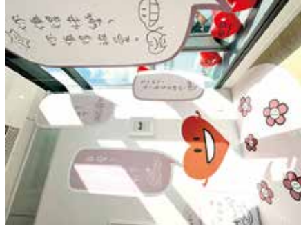
臺灣塵舍舉辦新展覽。

Dustykid 設有國際版，在海外流傳，其中特別受到英國大學生歡迎。Rap 稱 Dustykid 突破膚色的界限，是世界通用語言，並可以成為一個示範——做好自己，走出國際。