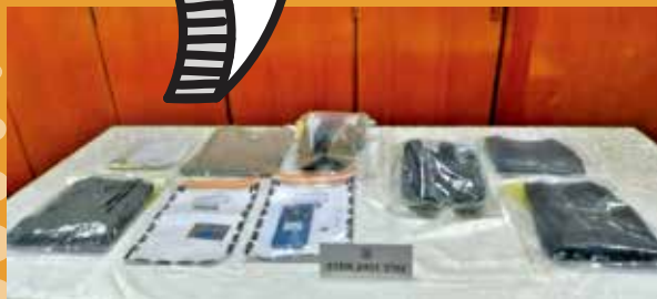
被捕的兩名雙程證男子，涉及有關案件。