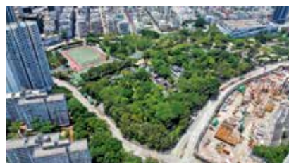
城寨原址已改建成九龍寨城公園。