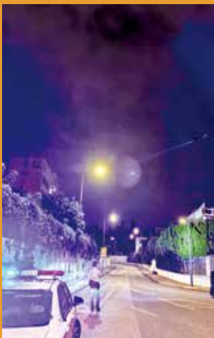
新界北總區 5 月展開跨部門反爆竊行動。