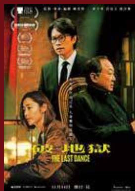
香港版電影海報，由著名美指張叔平操刀，「華」「文」矚目合體。