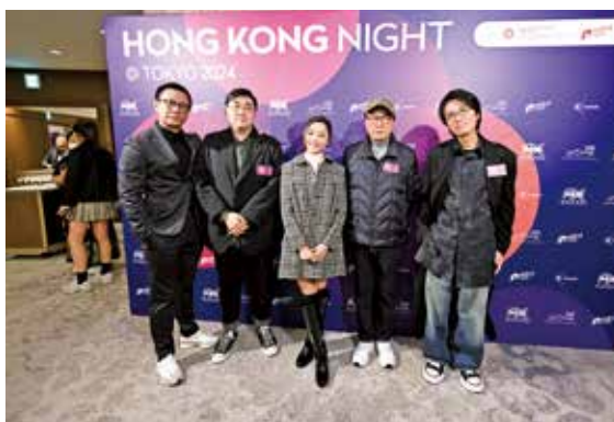
與一眾演員出席東京電影節。

誰說導演不自信？只不過，他的自信不是來自往績或止於姿態，而是已經融入到他對創作的投入和對表達的篤定，不然他怎麼會寫出令人信服的劇本。