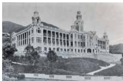
大樓屬港大最古老的建築，圖為建成初期情況。（歷史圖片）

1911年成立的香港大學在本港有超過100年歷史，七幢建築先後被評為法定古蹟。當中，最經典莫過於該校首幢建築本部大樓，它於1912年落成，採用後文藝復興時期的建築形式，是本港現存古典復興式建築物的典範，內裡的禮堂「陸佑堂」亦是舉辦大學重要學術和社交活動的場地。