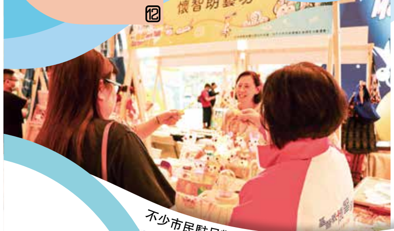
不少市民駐足觀賞。