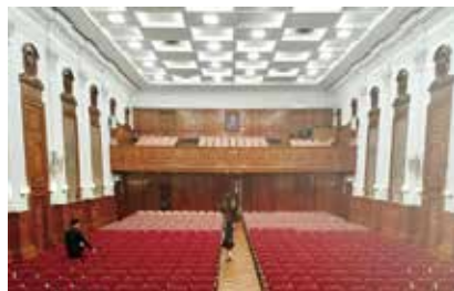
陸佑堂是大學百年來舉行重要典禮場地。