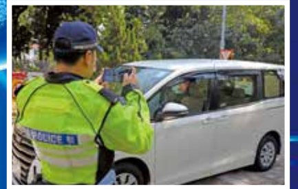
警方指出，駕駛者未來可網上查告票付款。