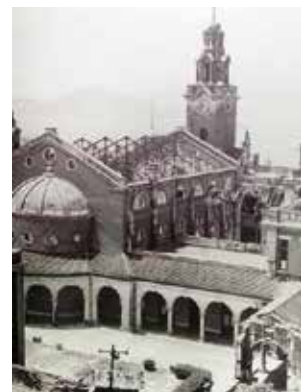
禮堂陸佑堂的屋頂在二戰時被拆走。

直至1946年10月香港大學才復課，復課後同年曾舉辦頒授學位典禮，有記述當時典禮在上蓋被拆毀、地板被撬去作燃料之禮堂，即陸佑堂舉行。戰前禮堂四壁之金漆木框肖像，亦失去蹤影，要經過一段時期後才完成修復。