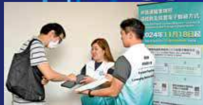
運輸署 18 日起，收集核實辦證照者聯絡方式

全港逾 200 萬駕駛執照持有人，須陸續向運輸署登記並核實「電子聯絡方式」，以配合早前立法會通過的「告票電子化」工作。市民由即日起辦理駕照及車輛等牌照時，須提供手機號碼或電郵作電子聯絡方式，否則運輸署將不處理其申請。而告票電子化計劃將於明年上半年實施，政府稍後會公布實施詳情。