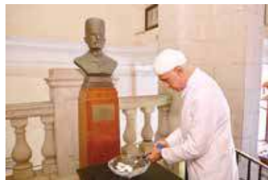
設麼地銅像紀念其捐款興建大學。

自2017年港大新落成的百周年校園啟用後，港大文學院遷離本部，本部大樓亦隨即翻新，現時屬於校園非公開區域，若要進入大樓內部，非港大師生要事先預約。