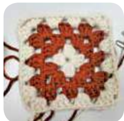
工作坊教區內街坊勾織「祖母格」。

加者教授「祖母格」的編織工法。他表示祖母方格得名是由於過去毛冷稀缺，家中長輩會將破爛毛衣拆開，將毛冷重複編織成小方格，再縫合成日常織品。