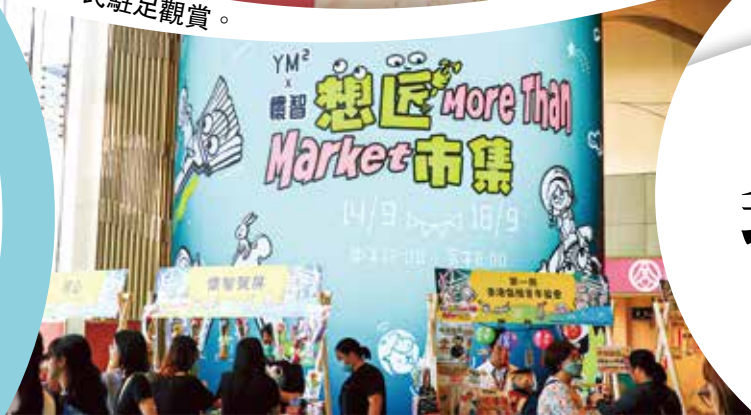
活動主題為「想匠」，鼓勵一同探索世界。

藝術是全人類的共同語言。這群特殊需求人士用他們靈巧的小手傳遞溫暖，在社區市集上向公眾展示自己的才能。