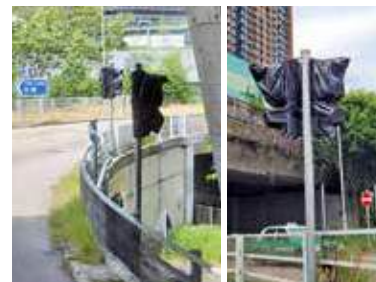
南行交通燈完成安裝，以黑膠袋圍封。

周希望部門盡快公布實施新安排的日期，提前在公路上的指示燈牌作出提示，並加強宣傳，以便居民盡早適應新安排，避免引發不必要的混亂。