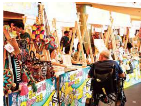
市集早前（中秋）在觀塘裕民坊舉行。