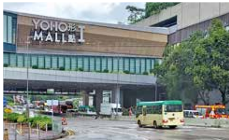
商場停車場假日多見車龍，並倒流交匯處。