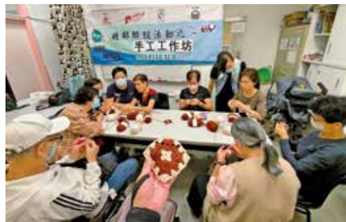
隊員齊心辦好手工工作坊。