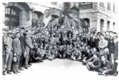
孫中山1923演講後，與學生在大樓外合照。（歷史圖片）