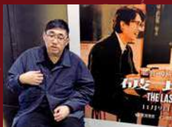
談起原生家庭，心有戚戚焉。

陳導演回應指，每一個家庭都很獨特，在我未成家立室的時候，我的家庭是我爸爸的家庭。當我傳承了子嗣時，那個就是我的家庭，我就需要對此負責，這就是中國傳統家庭。所以，當這個是屬於我爸爸的家庭時，我就要聽從他；而當這個家庭屬於我時，便是我作主。