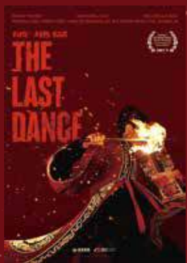
《破·地獄》國際版海報，英文名The Last Dance由導演自己起。