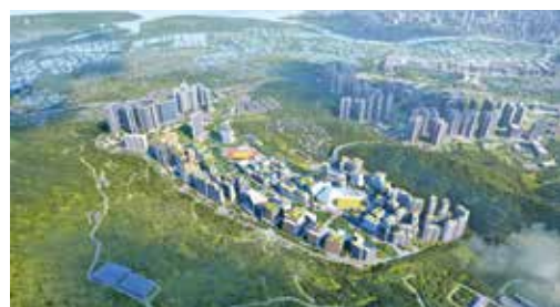
北部都會區牛潭尾日前公布初步規劃。(效果圖)

10月新一份施政報告公布，北部都會區預留至少80公頃用地發展北都大學教育城。而11月中發展局緊接公布的牛潭尾初步規劃中，包括建議於東部預留約46公頃土地發展大學城，培訓高端人才以支援新田科技城的創科發展，亦可培訓更多醫