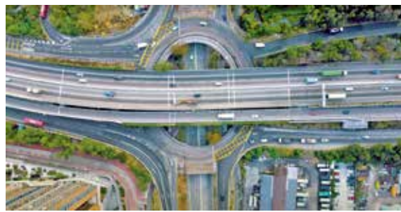
博愛交匯處正進行加裝交通燈工程。

元朗交通樞紐博愛交匯處進行改善工程多年惟擠塞不減。運輸署前年提出迴旋處新方案，在元朗公路南北行兩個路口加設交通燈，因應不同時段車流調節燈號，希望令車輛有序進出迴旋處。近期，交匯處裝上燈號惟未正式使用，有居民擔心新措施無助塞車，反而會加劇塞車，有地區人士提出優化建議，並認為應盡快使用並密切監察交通燈實際成效。