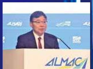
林世雄早前表示「電子化」。

另外，車主續牌時亦毋須出示俗稱「驗車紙」的《車輛宜於道路上使用證明書》，及俗稱「牌簿」的車輛登記文件。運輸署亦會提升網上申請的內部系統，以連繫保險業聯會的汽車保單認證系統，屆時只要保險公司向該系統提供相關紀錄，申請人於網上遞交續牌申請時便毋須上載保單。