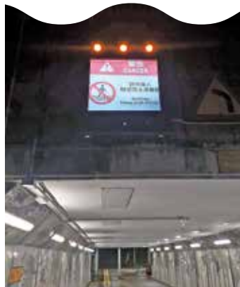
大埔河旁水浸警告系統上月首次啟動。