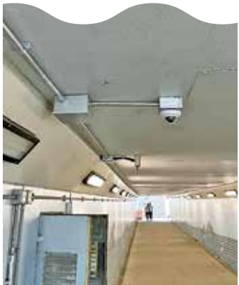
隧道內閉路電視，向控制中心傳送即時資訊。