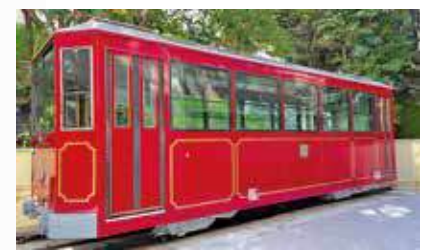
天台展出一列山頂纜車退役車卡。