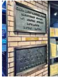
文化館展出1950年代的中電總部門牌。