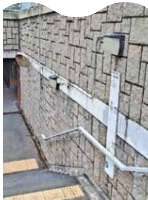
近廣福邨行人隧道內設水深參考間尺。