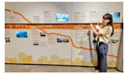
常設展區有介紹本地電力發展史。