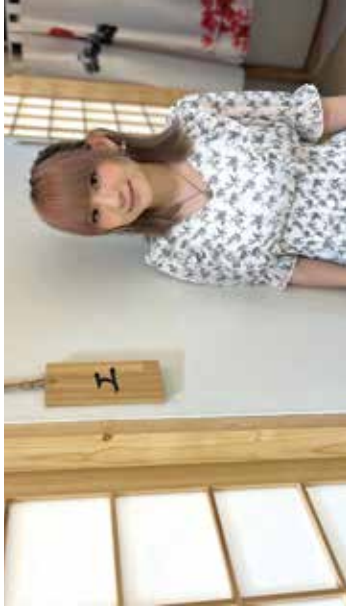
Noel 正職是教日文，近年成立了「Kimimo 日語教室」。