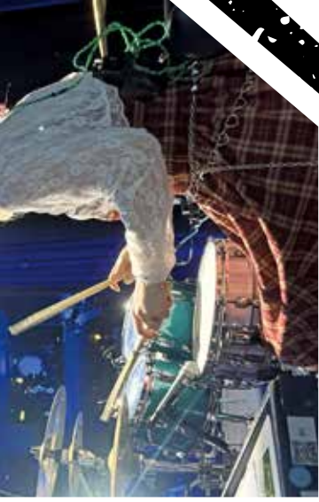
「打鼓唔一定係「粗魯」，扮靚靚或斯文樣都打得！」