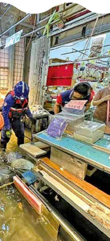
民安隊助沙頭角居民搬沙包防洪。