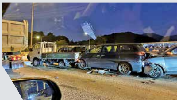
涉11車連環相撞意外發生於12月2日。