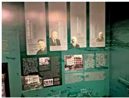
其中一個展館介紹嘉道理家族。