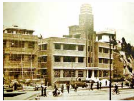
1940至2012年，大樓建築為中電總部。（歷史圖片）