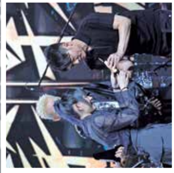
《擊戰2》比賽過程頗dramatic，由前期不斷輸，最後竟贏冠軍。