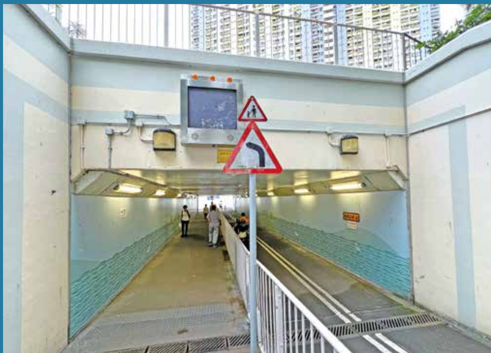
路政署於16條行人隧道安裝水浸警告系統，圖為沙田城門河旁的行人隧道。