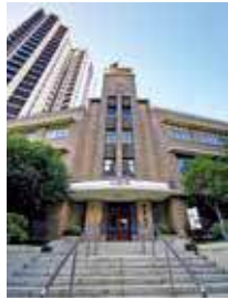
中華電力總部2018獲評一級歷史建築。

1901年成立的中電，是本港最大的電力公司，隨着九龍及新界的用電需求日增，日益壯大的中電於1940在何文田亞皆老街及窩打老道交界設立行政辦事處大樓。該大樓中央的鐘樓，亦成為附近地標。雖然中電其後搬遷總部，亦在該處發展住宅物業，但該大樓獲保留下來，並於2023年改建成中電鐘樓文化館，向公眾開放介紹本港電力發展的歷史。