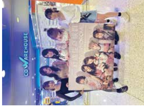
任 Cozy Syndrome 的鼓手，為音樂注入節奏感。