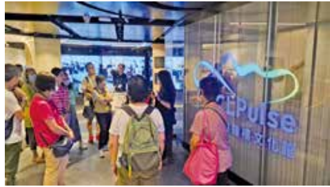
中電鐘樓於2023年5月活化後開放。