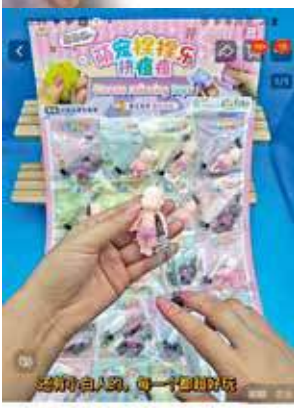
同類玩具以打針雞、擠痘痘形式，網上有售。

朱國強促請當局聯同相關玩具進口地，源頭打擊不安全玩具及兒童產品進口，並盡快向家長及學校宣傳這些玩具的潛在風險。