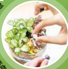
製作微景觀植物瓶 - 體驗心放鬆。