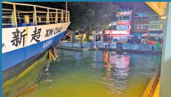
天文台指風暴潮遇天文大潮，低窪地區或水浸。

謝威寶續指，雖然今年11月第三個影響本港的熱帶氣旋「萬宜」，整體風力不及此前的「銀杏」及「桃芝」，但因正值天文大潮，本港水位在11月18日晚間漲潮時升得特別高，當中鰂魚涌、大澳及大埔灣的最高水位，分別上升至海圖基準面以上3.36、3.36及3.52米，分別打破其11月最高水位紀錄。