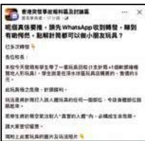
打針玩具攻港消息，在家長群組瘋傳。