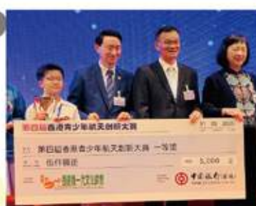
▲「香港青少年航天創新比賽」 最高榮譽的全港一等獎