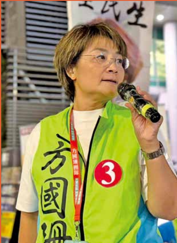
方國珊爭取落實水上活動中心。