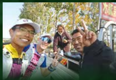
人情風貌是旅程中的最大收穫。

夕陽下，這個曾經迷失方向的騎師，如今在奔跑中找回人生意義。他的腳步不僅丈量着土地，更在無數年輕生命中播下希望的種子。