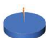
2025年度學生選校志願