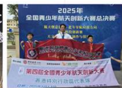
▲學界冠軍學生獲資優教育學苑推薦代表 香港到海南島參加全國創科賽