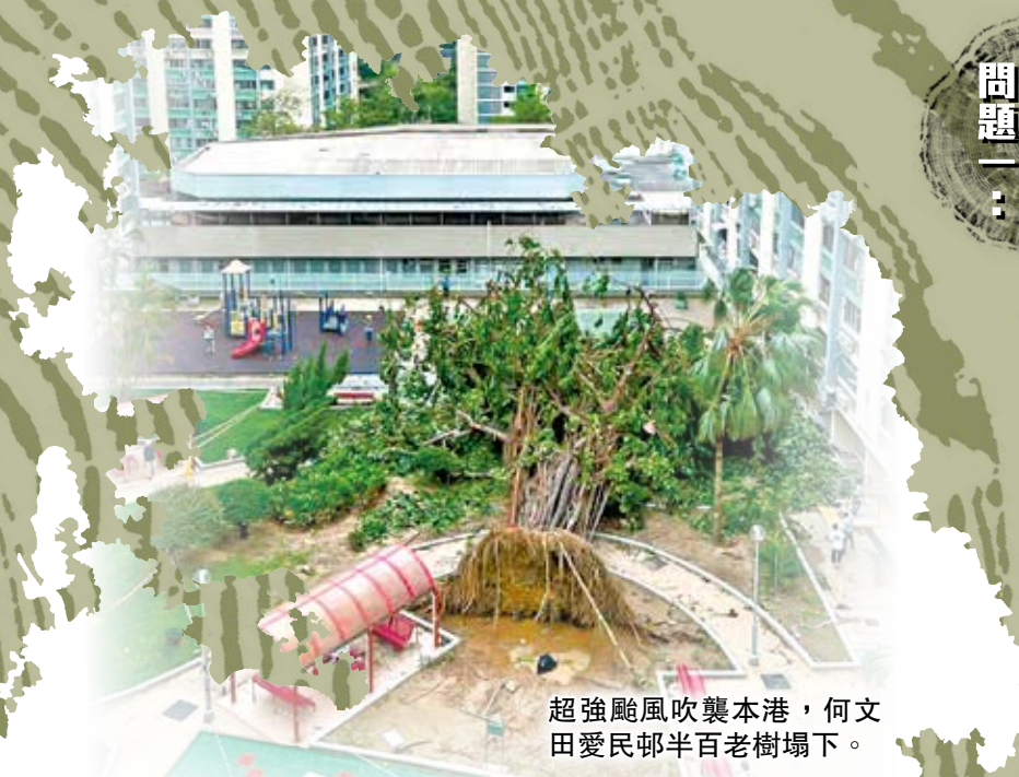
超強颱風吹襲本港，何文田愛民邨半百老樹塌下。