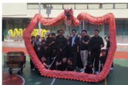
▲舞龍隊屢奪本地冠軍, 更遠征國際揚威, 登上ViuTV推廣國粹, 傳承中華文化