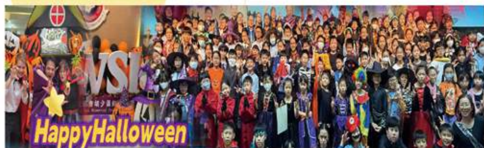
▲多元活動語境日: 實踐所學, 沉浸體驗, 活學活用

在2024至2025年度, 全年有7位學生入選香港代表隊、22位入選屯門區代表隊、2位入選新界區代表隊、5位入選學界學生代表隊及4位入選全港青年軍。