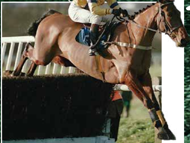
現在的長跑好手，昔日曾當職業騎師。