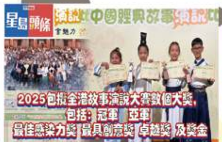
▲演說精英包攬全港故事演說大賽多個大獎