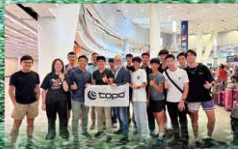
九名學生，每天清晨堅持十公里跑步後，漸見自信。