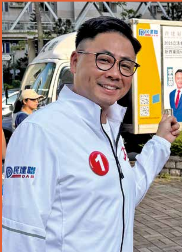
葉傲冬政綱提出東九龍線延伸到寶林、翠林。