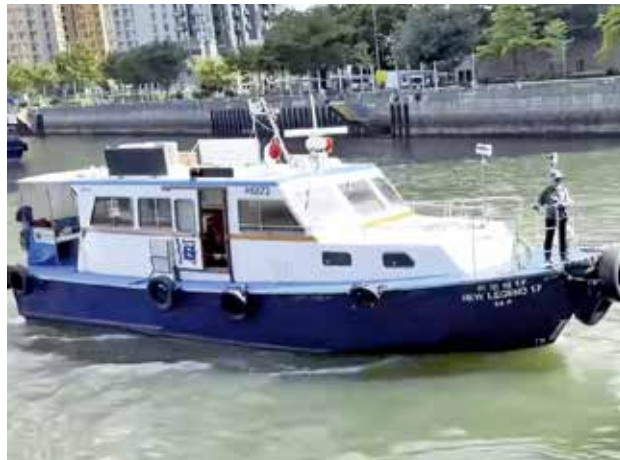
將軍澳至西灣河開航後客量平平。