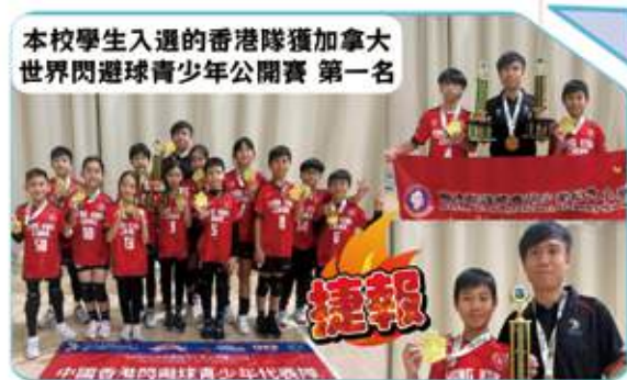
本校學生入選的香港隊獲加拿大 世界閃避球青少年公開賽 第一名