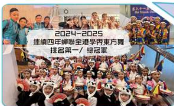
2024-2025 連續四年蟬聯全港學界東方舞 排名第一/總冠軍