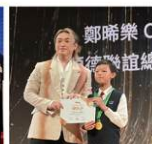
▲蟬聯全港STEM獎勵計劃金章