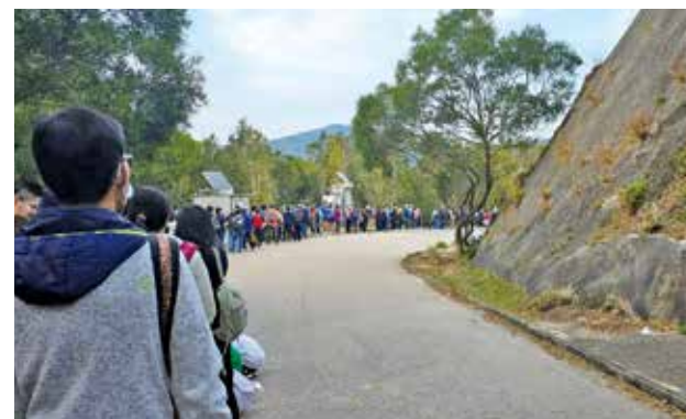
東壩旅客激增，喚起社會關注郊野遊。