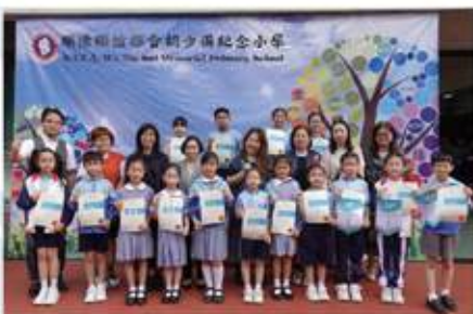
▲第76屆香港學校朗誦節中, 胡小學生勇奪 八冠、十二亞、十四季