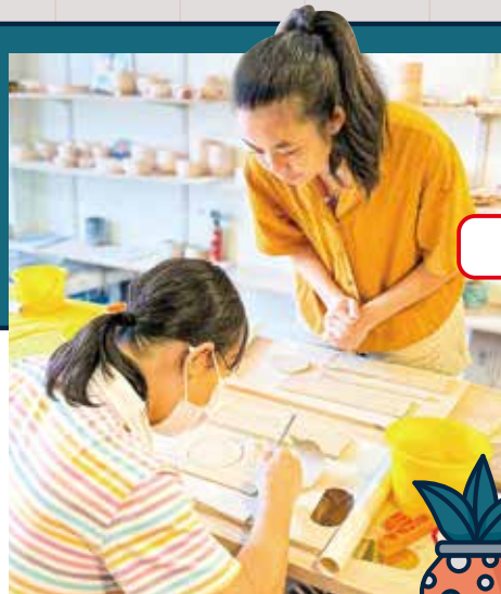
她喜歡與人交流，Yellow Pear Co. 也成為西貢社區裡一個相遇點。

她最難忘的一次，是一位81歲婆婆與女兒一同參加陶藝課。「婆婆第一次摸到陶土時，眼神閃着光，那一刻我覺得學習沒有年齡限制。」她停頓了一下，語氣柔和。「做陶藝，不只是做作品，而是陪人找回感覺，那種專注，那份初心。」