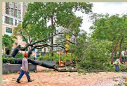
深井一棵大樹在樺加沙襲港期間倒下。