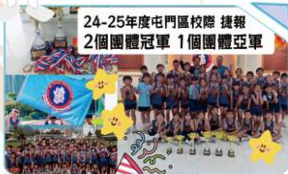
24-25年度屯門區校際 捷報 2個團體冠軍 1個團體亞軍