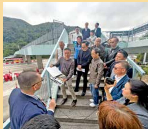
沙田區議會代表去年曾到大老山隧道巴士站察看。

向西北方延伸，分拆另一排巴士站，並會加建行人通道上蓋。此外，亦會一併進行相關道路、渠務、公用設施、公共照明、環境美化及綠化工程、藉以提升巴士轉乘效率，紓緩繁忙時段的交通壓力外，亦一併改善候車環境。