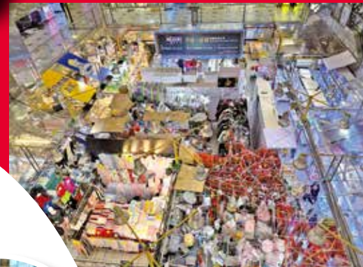
葵涌廣場向來有「掃街天堂」之稱。