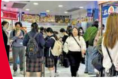
旺角中心通道設立食區域。