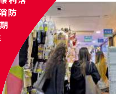
旺角中心通道被衣飾品佔據一半。

「社區消防隱患」系列的上集報道中，《我家》記者巡視本港多個商場發現，有商場內小食店林立，部分存在消防隱患，政府應加大力度巡查和檢視消防設備。