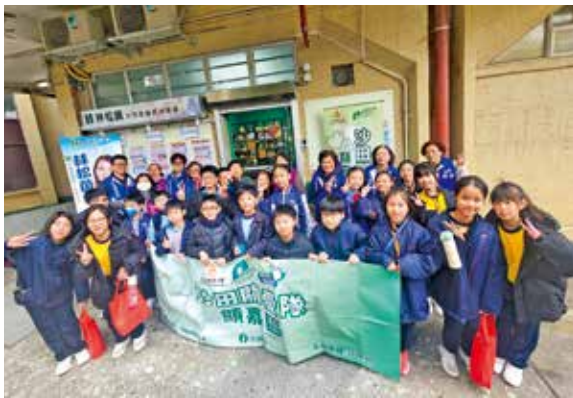
團隊與區內小學舉辦長者探訪活動。

沙田顯嘉小區關愛隊與東莞工商總會張煌偉小學，於1月22日在顯徑邨攜手舉辦長者探訪活動，作為「兒童議員計劃2025：童聲共響」的實踐環節。小學生擔任的「兒童議員及助選團成員」，化身愛心大使，與關愛隊隊員一同走進社區，親手向長者送上福袋與祝福。