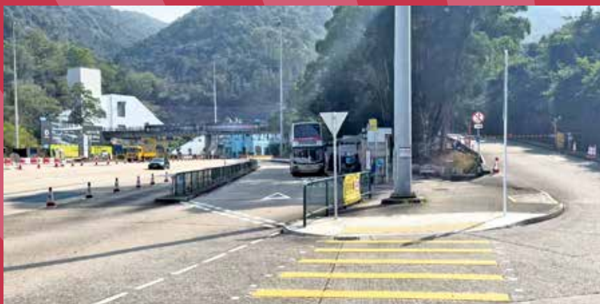
往沙田方向的巴士站倒灌問題，近年稍有改善。