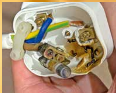
13A應以20A電的電器，被人以