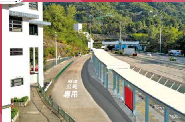
新計劃建議將往九龍方向巴士站全外移。(效果圖)