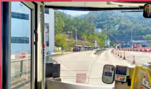
現時往九龍方向只可同時讓4輛巴士埋站。

《我家》於去年3月報道，政府計劃擴建大老山隧道巴士轉乘站。事隔近一年再有新進展，政府爭取在今年內開展擴建工程，將原有往九龍方向的整組巴士站向外移，同時一併擴建往沙田方向的巴士站，令來回方向均可同時讓七輛巴士「埋站」。惟最新方案仍未一併納入加設洗手間的建議。有地區人士建議部門正視，完善候車配套的需求。