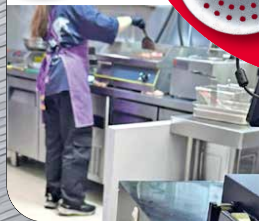
小食店內設有電磁爐、炸物爐等。