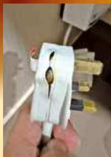
有單位安裝熱水爐不當，導致插頭燒毀變形。