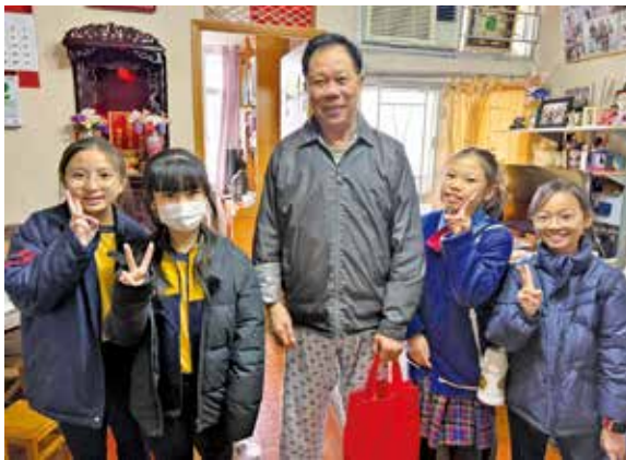
小學生親手向長者送上福袋與祝福。

校方亦分享指，是次活動為學生提供了寶貴的社區參與經驗，讓他們在課堂以外學習尊重、聆聽與付出，長者亦感受到跨代間的溫暖。未來將會繼續推動多元學習，鼓勵學生服務社群，培養具社會責任感的公民素養。