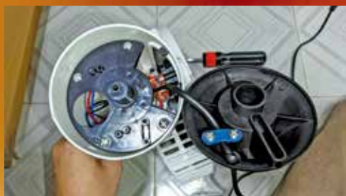
有人13元購買的風扇，拆開後見電線接駁簡陋。

立法會議員陳仲尼認為，很多市民跨境網購電器，但這些電器往往不符合香港的安全法例標準，市民自行改裝插頭後，容易出現漏電、短路，甚至引發火災的嚴重風險，存在重大安全隱患。此外，跨境網購電器沒有強制能源標籤，網店亦無需繳付香港的廢電器回收稅項，變相令本地守法商戶處於不公平競爭環境。因此他希望可與部門及業界推動相關措施，保障市民安全。