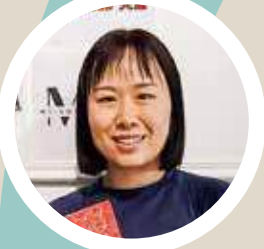
Ivy表示，老師對人細心。