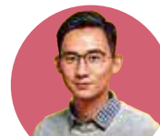
作者： 陳洛志 醫師