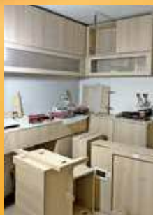
事主表示單位完成裝修入伙後兩日便出事。