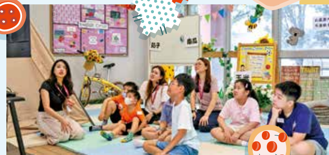
幼稚園學生及家長一起學習環保。

環保教育，對佛教志蓮小學而言，是一段需要「一齊做」的生活經驗。學校早前舉行「小手做大事——一日親子環保體驗」，邀請幼稚園學生及家長走進校園，透過親子一同參與，將環保學習由校園帶回家庭，再連結社區。