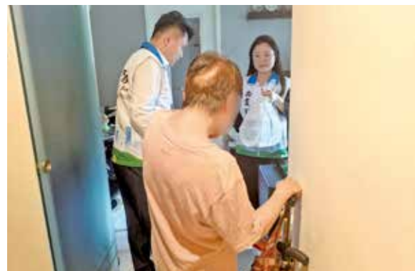
團隊即時支援受影響長者。

大廈爆水管後果可大可小，如果爆水管導致鹹水浸入電梯馬達、線路或機坑，即使水乾，零件也可能因鏽蝕需更換。較嚴重事故或致升降機需數星期甚至更久才能恢復運作。新都城二期第9座4月中有單位發生鹹水管爆裂，積水湧出，一度影響該層四部升降機出入口，導致全部升降機需即時停用。現場更傳出異味，對高層住戶尤其造成不便。