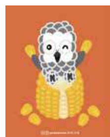
與芭芭雞相處的日常生活，成為Yoyo創作與生活的一部分。