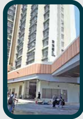
居民正忙於委託工人進行裝修。