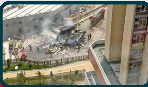
安達臣新居屋安麗苑自去年底陸續入伙。