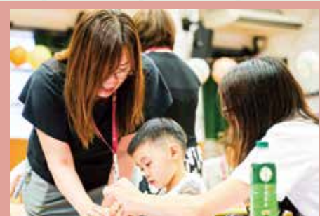
學校協助培育社區的孩子。