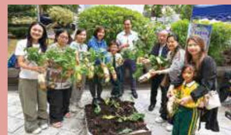
一間學校，慢慢連結學生、家庭與社區。