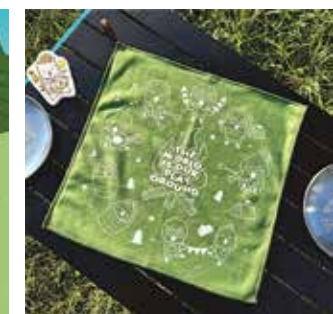
品牌「雞雞家族」有周邊產品。