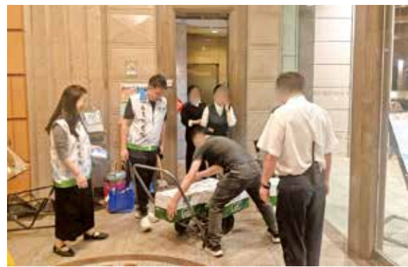
義工在大廈地下大堂派發食水。

胡表示，關愛隊的使命就是在緊急情況下發揮鄰里互助精神，及時為有需要的居民伸出援手。