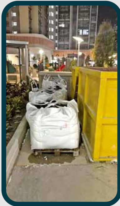
工人擅自將工具鎖在屋苑隱蔽位置存放。