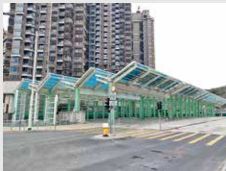
4月19日廢料堆發生火警，產生大量濃煙。

立法會議員方國珊表示，居民整體交通路線及班次不足，將繼續爭取增加來往觀塘及將軍澳等巴士服務，並跟進117A小巴車長服務態度及117B開辦進度。西貢區議員邱浩麟則促請全面增加現有公共交通班次，包括加密117A小巴班次及爭取13及213E巴士線提供全日化服務。