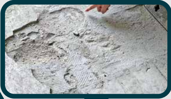
有居民發現不少設施已見損毀。

位於西貢區大上托的安達臣安麗苑，自2025年底陸續入伙，惟近月管理問題持續發酵。這個有1,380個單位的新落成居屋屋苑，近期被揭發有多名無牌小販長期在邨口公然擺賣英泥、沙石等建築材料。加上有裝修工人粗暴拖行裝修材料，導致公共設施永久損壞，更因廢料亂棄引發大火，令已入伙及正在裝修的業主深感威脅。有地區人士協助跟進管理情況。