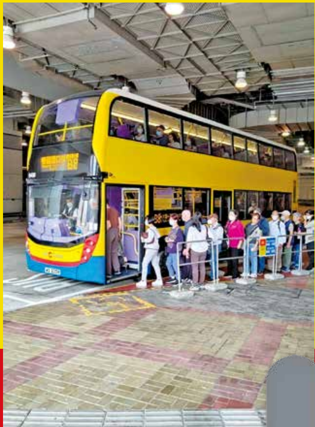
沙田居民現靠接駁B8線到香園圍口岸。

萬眾期待的新皇崗口岸聯檢大樓即將落成。啓用後口岸將實施「一地兩檢」安排，並取消現有的皇巴士接駁服務，實現人車直達口岸。隨着開通日期漸近，運輸署近日公布多條專營巴士路線的規劃，當中包括馬鞍山居民期待已久、直接來往新皇崗口岸的巴士線。該線同時將成為馬鞍山首條全日來往科學園及古洞北的巴士線。有地區人士歡迎有關安排。