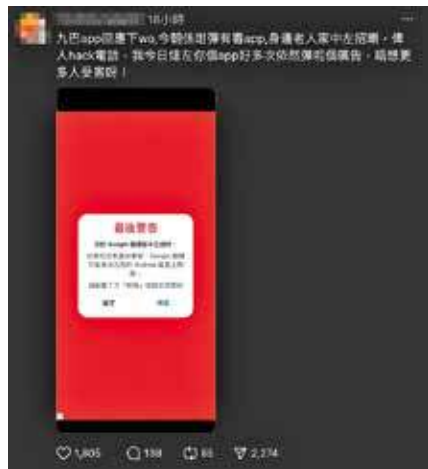
有市民投訴九巴App1933反覆出現疑似釣魚廣告。