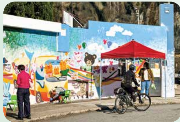
原本只是單車上坡路，如今多了一個讓人停下來理由。