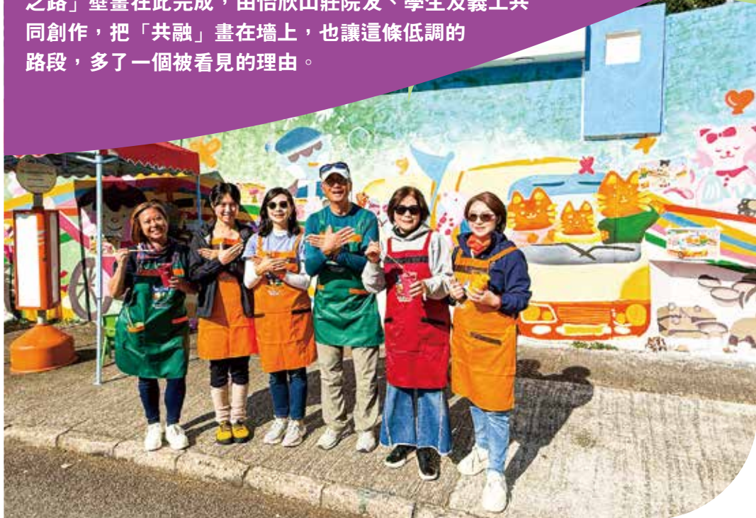
「共融壁畫」位於怡欣山莊正門外，製作累計3,000小時。

沙田亞公角山路沿線聚集多個復康及照顧服務單位，平日人流不多，多是家屬、職員與單車人士出入，像城市裡一段被輕輕掠過的角落。近月，一幅長40米×7米高的「復康之路」壁畫在此完成，由怡欣山莊院友、學生及義工共同創作，把「共融」畫在牆上，也讓這條低調的路段，多了一個被看見的理由。