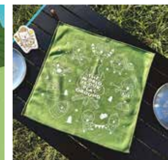
品牌「雞雞家族」有周邊產品。