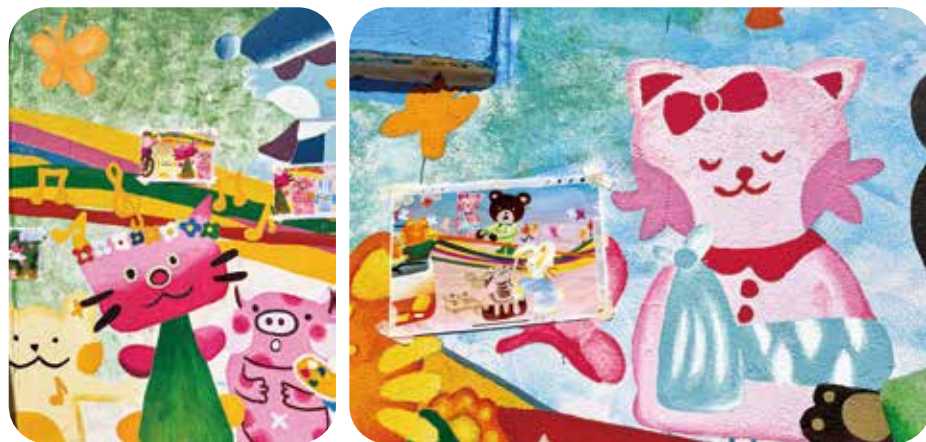
壁畫角色多由院友原創設計，再由學生重新演繹。