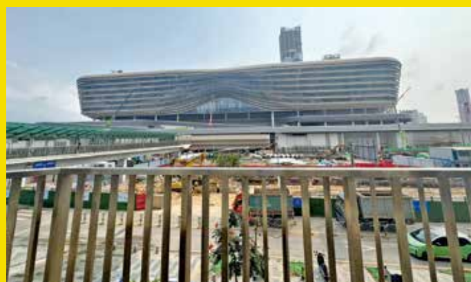
新皇崗口岸聯檢大樓主體結構已完