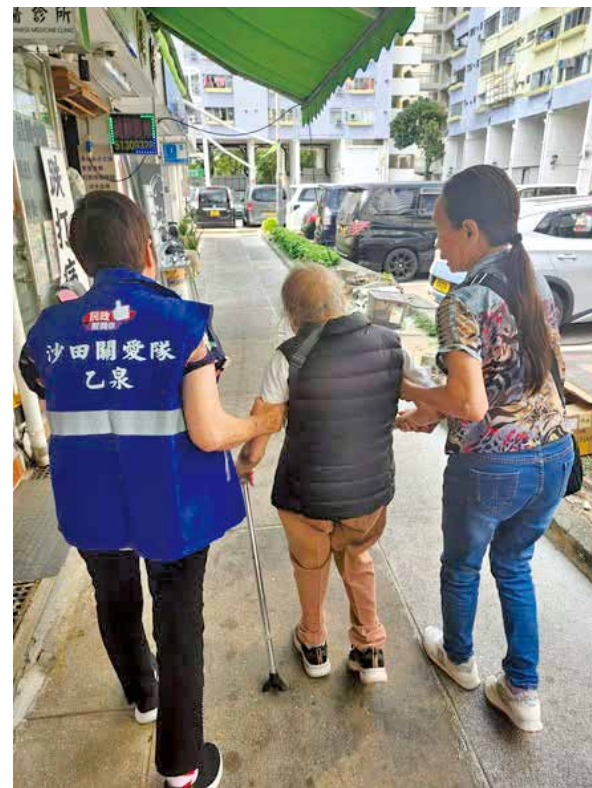
團隊助4月中協助尋回老退化症婆婆。

關愛隊作為社區最前線的支援網絡，往往能迅速發現並回應居民的實際需要，尤其對於長者及患病人士而言，一個及時的協助，足以避免意外發生，守護他們的生命安全。