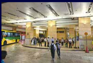
去年新開辦往中環巴士線時，不少居民排隊候車。