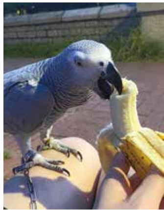
不少飼主習慣以「雞」作為對鸚鵡的暱稱，「芭芭雞」這個名字亦是由此而來。