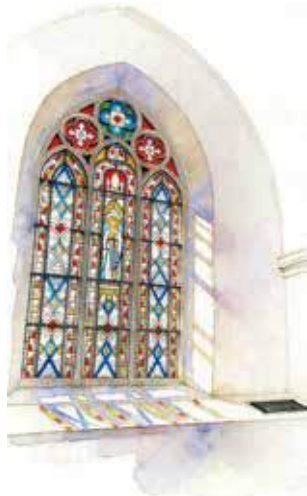
原有彩繪玻璃窗曾一度散失。

一直是熱門婚禮場地的伯大尼修院，坐落於薄扶林的山嶺之上。該座米白色的新哥德式建築靜靜矗立逾一個半世紀，是巴黎外方傳教會於1875年興建的遠東首座傳教士療養院，到現時成為演藝學校園一部分，見證本港歷史古蹟用途的跌宕變遷，更曾經歷一度面臨被拆卸的危機。