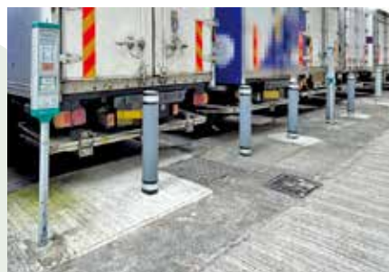
上水有停車收費錶範圍內，整排大型貨車泊位近半無入錶。