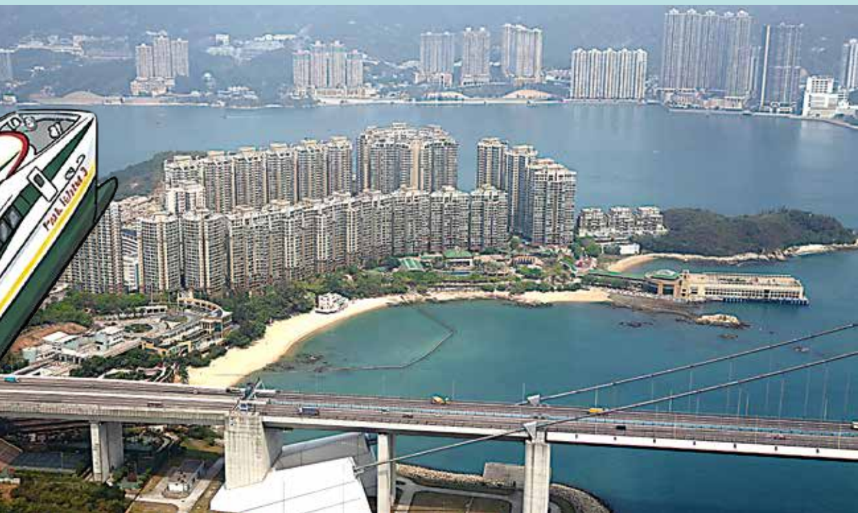
馬灣人出入主要依賴居民巴士及渡輪。