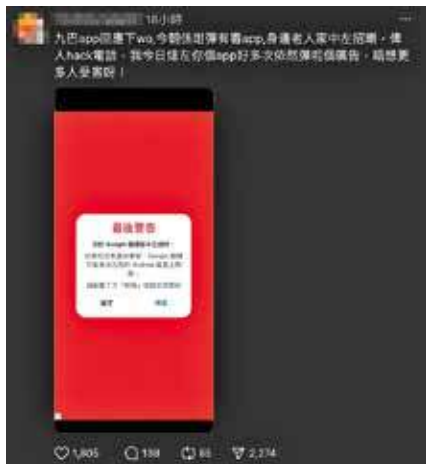
有市民投訴九巴App1933反覆出現疑似釣魚廣告。