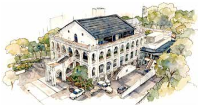
修院採典型的新哥德式風格建築。