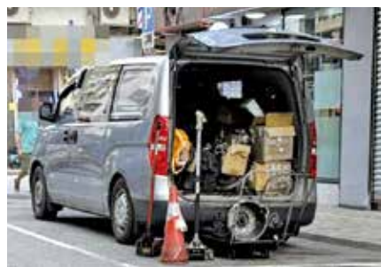
粉嶺聯和墟有車輛未有入錶，霸佔車位長時間上落貨。