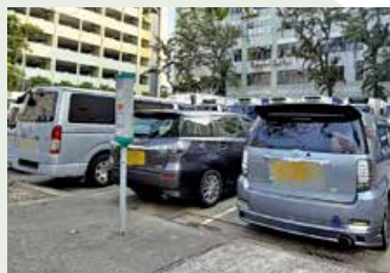
AI智能泊車管理，2025年第四季啓動兩個月試點計劃。