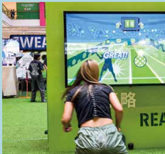
會場加入數碼互動體驗，帶出Pickle的運動樂趣。

荃灣D·PARK中庭，多了此起彼落的擊球聲。有人圍觀，有人試打，一場比賽，慢慢把運動帶入街坊的日常。