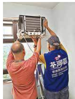
團隊協助配對同邨居民轉贈冷氣。

因此在4月18日，該隊派出隊員先到贈送者家中，將兩部運作正常的冷氣機安全拆下；下午再運往求助長者戶，將壞機拆卸後，幾經辛苦重新裝上正常冷氣機，最終成功長者戶終於有涼爽的冷氣可用。他形容，是次行動既幫助了有需要的長者，亦促成了電器循環再用，為環保出一分力，充分體現社區互助的精神。