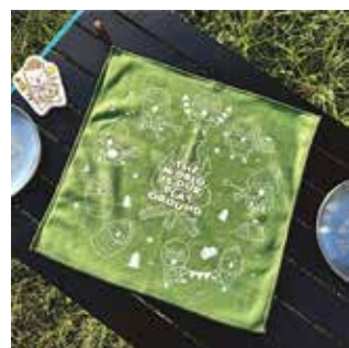
品牌「雞雞家族」有周邊產品。