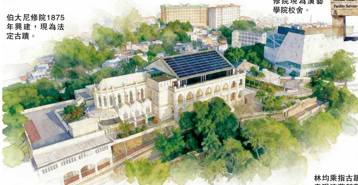
修院現為演藝學校校舍。