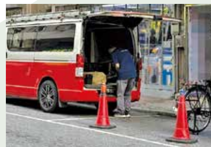
粉嶺聯和墟，有商舖將雪糕筒放置在咪錶位附近疑霸位落貨。