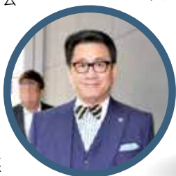
陸偉雄形容，相關信件在格式上模仿度高。

旺角警區事後在社交媒體專頁發文提醒，指近期接獲街坊反映收到懷疑詐騙信件，這些信件偽裝成政府部門公文，內容提及「檢控部」及「抄封令」等字眼。警方呼籲市民，收到可疑法律文件時，應先透過官方渠道查詢相關部門的聯絡電話，並直接致電核實。同時，切勿隨便掃描來歷不明的二維碼，以防手機被植入惡意程式或誤導進入釣魚網站。