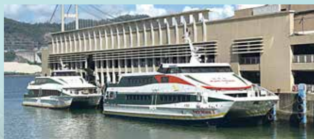
營運商解釋，停駛部分船班次因人手短缺。