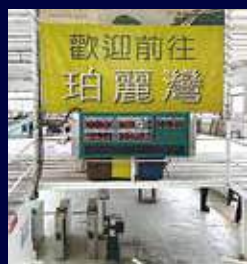
停駛渡輪航班包括來往荃灣到馬灣航線。