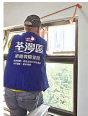
隊員協助拆除冷氣機，再運往求助長者戶。