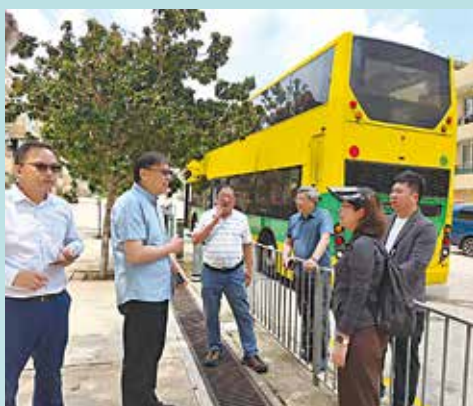
3月起雙層巴士已開始在馬灣巴士線執勤。