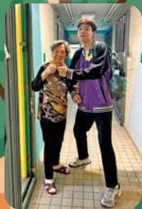
一句問候、一段陪伴，讓學生學會關心，也讓長者感受到久違的人情味。