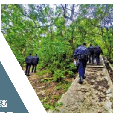
警方近期加強在區內進行反爆竊「捲聲行動」。