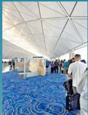
不少遊人使用機場提供的免費充電服務。