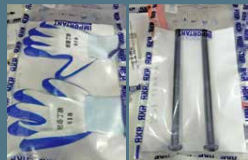
4月，警方在壁屋截查男子檢獲螺絲批等工具。

除了西貢鄉郊，將軍澳唐俊街屋苑「Monterey」的獨立屋，5月中亦屢次成為賊人獵物。5月9日，先後有兩間獨立屋遭賊人光顧，雖無損失，惟3名賊人逃去無蹤。警方高度關注，迅速翻查