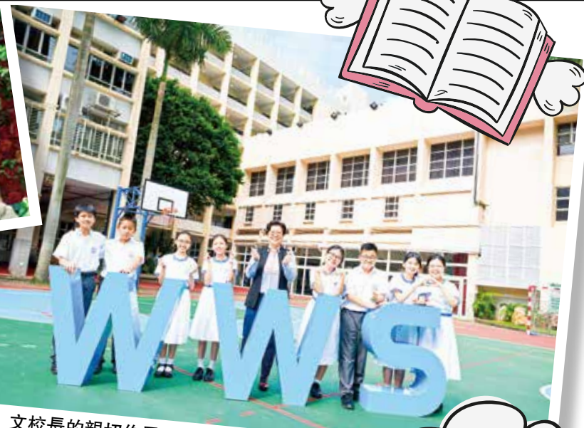
文校長的親切作風，拉近與學生的距離。