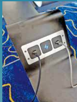
有市民稱機場充電位導致手機出現問題。