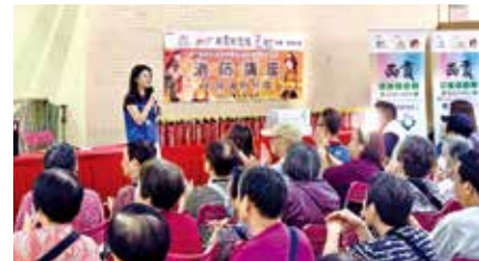
團隊與調景嶺消防局合辦消防講座。

西貢彩健小區聯同健明小區關愛隊，於5月16日在彩明苑與調景嶺消防局合辦消防講座，吸引眾多街坊踴躍參與，現場反應熱烈。