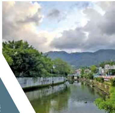
蠔涌路一間獨立屋女屋主報案稱遭爆竊。