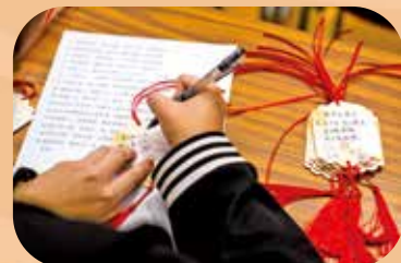
中四學生親手製作佛誕福袋與菩提珠手鏈。