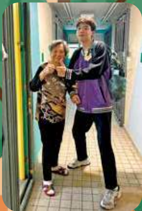
一句問候、一段陪伴，讓學生學會關心，也讓長者感受到久違的人情味。