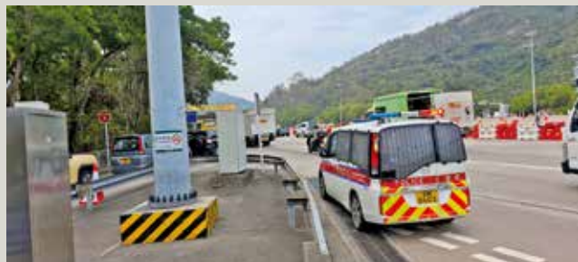
改道前，警方不時派員疏導交通。