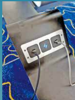
有市民稱機場充電位導致手機出現問題。