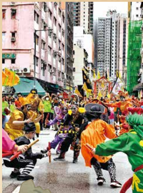
鑼鼓一起，畫上臉譜的英歌隊穿街而過。