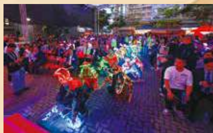
加入夜光元素，令傳統表演在夜間巡遊中展現另一種活力。