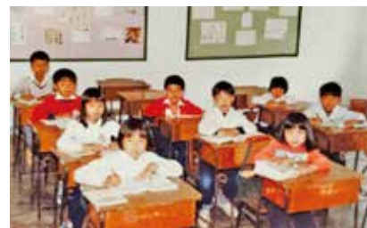
對舊生而言，啟才學校是成長的集體回憶。

並重的客家傳統。亦象徵教育與德行。啟才學校最具特色之處，是右側開間上下兩層闢為協天宮，供奉關帝，由村民集資籌款建成，形成「校廟合一」的空間配置。這種將教學與宗教功能結合的設計，在本港極為罕見，反映客家村落對知識與信仰並重的精神，亦象徵教育與德行並重的客家傳統。