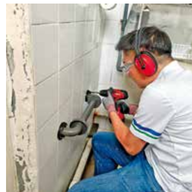
為區內長者及有需要者安裝安全扶手。

梁形容完成安裝後，長者笑着驗收裝好的扶手，並接過義工送上的福袋，氣氛溫馨。他表示希望透過今次活動，將建築專業化作社區關懷，為長者築起生活上的安全感。義工以專長回饋社會，可持續為區內有需要人士提供適切支援，共建安全及關愛的居住環境。