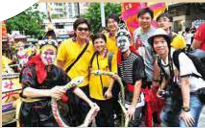
金師傅常擔任舞蛇者「時遷」一角，走在隊伍前方探路。