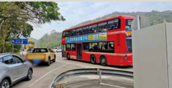
大欖隧道往九龍方向八鄉入口過往擠塞情況。