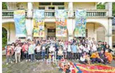
鄉村初夏藝術節2026活動，部分在啟才學校舉辦。