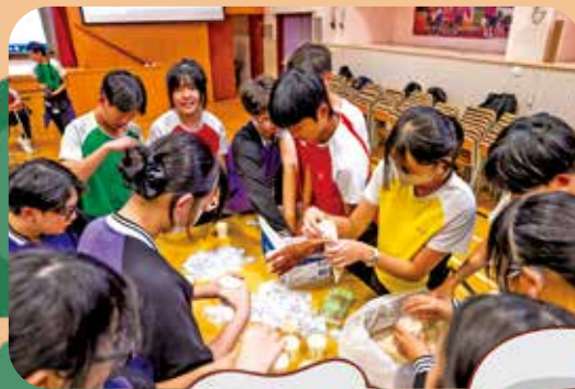
把祝福與善念帶進社區。