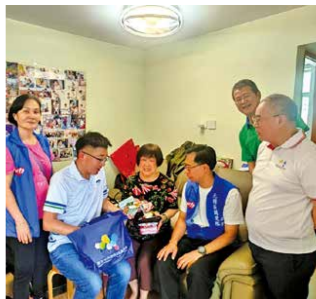
義工進行社區探訪。

元朗北朗小區關愛隊於5月初舉辦家居安全探訪活動，聯同土木工程拓展處西拓展處及註冊專門行業承造商聯會的義工，走進朗屏邨，為區內長者及有需要人士安裝安全扶手，並提供家居及其他支援服務。