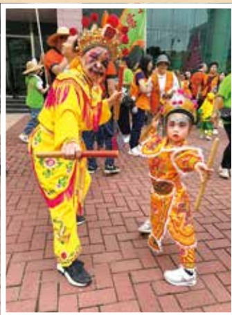
英歌舞結合武術步法與舞蹈節奏，展現剛勁有力的一面。