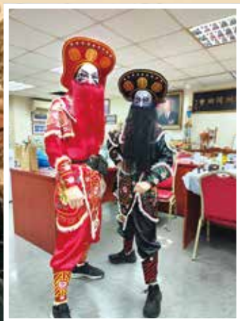
臉譜取材自梁山泊好漢形象，紅面紅鬚為「頭槌」，黑面黑鬚為「二槌」。