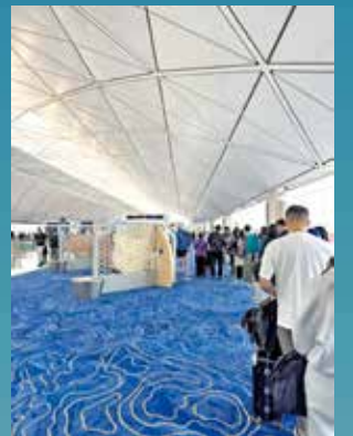
不少遊人使用機場提供的免費充電服務。