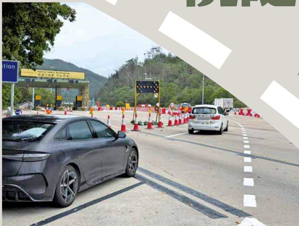
5月17日起，路口取消停車讓車的安排。

大欖隧道往九龍方向、位於八鄉入口的新交通安排已於今年5月中旬實施。原本駕駛者需要在路口停車讓車的安排，已改為可直接駛出的「匯合線」，旨在改善錦田八鄉一帶在繁忙時間經常出現的塞車情況，及解決車流倒灌至八鄉路的問題。「易通行」實施後，收費廣場拆卸騰出空間，有地區人士連月爭取優化行車安排，以求有進一步改善措施陸續實施。