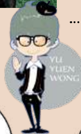
向全校分享活動過程與個人心得。