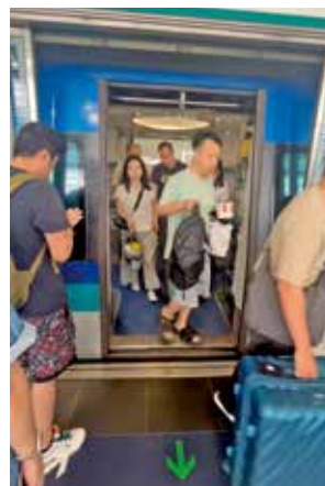
旅客在列車到站時紛紛離開車廂。