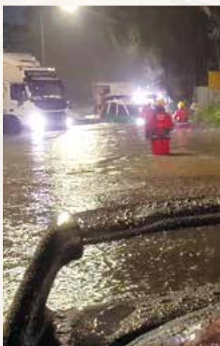
消防人員到場救出死火車輪中被困人士。