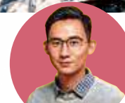
作者： 陳洛志 醫師