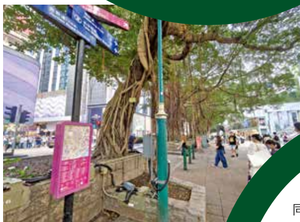
記者實測栢麗大道指示牌二維碼，得悉「頁面不存在」。