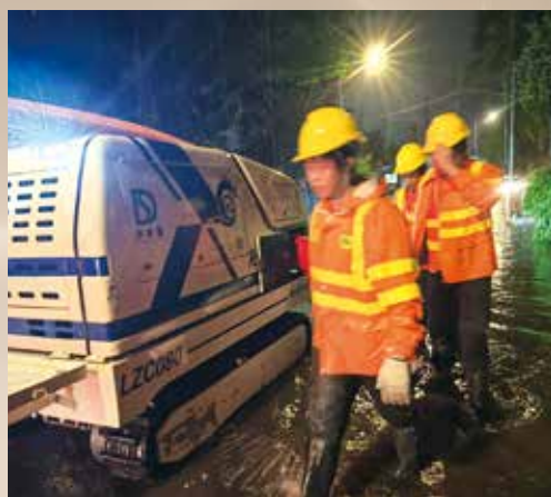
渠務署派出「龍吸水」機械人處理水浸個案。

道；長遠則於北部都會區推行綜合防洪管理策略，以「韌性防洪」為本，提升整體排洪能力。