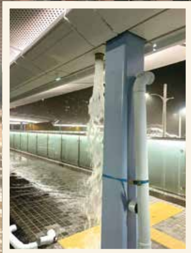
龍躍頭交匯處環形行人天橋有喉管突然甩脫。