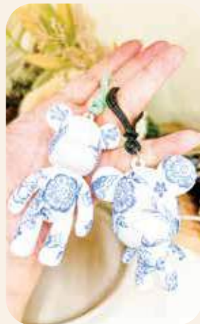
青花瓷小熊掛飾結合傳統青花瓷紋樣。