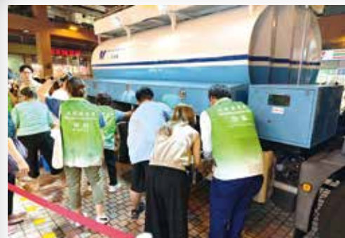
團隊協助在臨時取水點協助維持秩序。