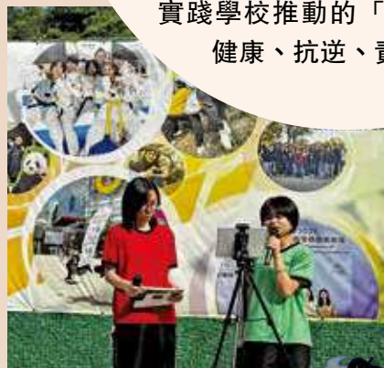
向全校分享活動過程與個人心得。