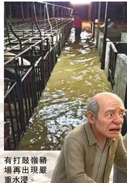
有打鼓嶺豬場再出現嚴重水浸。

5月本港兩度遭受暴雨侵襲，當中更發出今年首個紅色暴雨警告信號，北區在24小時內錄得超過300毫米雨量，打鼓嶺、坪輦多處嚴重水浸，交通癱瘓，居民被困，農戶損失慘重，不少居民對情況仍歷歷在目。連場水浸揭示區內排洪基建存在缺失，非法填土問題更進一步加劇災情。有地區人士期望當局在發展北部都會區時，能切實改善排洪能力。