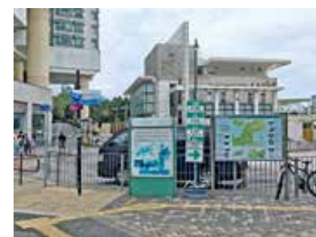
東涌港鐵站外的方向指示牌，沒有地圖相關資訊。