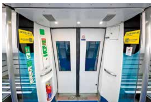
機鐵有提示提醒乘客兩個客運大樓方向。

新啟用，人流未算太多，故穿梭機鐵車廂的影響有限。但隨着愈來愈多航空公司櫃位遷入，加上T2設有不少新食肆，相信人流將會持續增加。