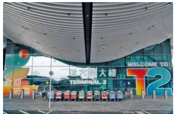
二號客運大樓5月27日正式啓用。

旅客可在T2完成保安檢查與出境手續，大樓設有新一代智能閘口，配備人臉識別系統，加快出境程序。不過，啟用初期旅客仍需乘搭自動駕駛列車前往T1登機閘口，T2的運廊及登機閘口預計2027年才正式啟用。另外T2啟用初期已開設14間食肆，手信店則有9間，另亦有其他商店及便利店。