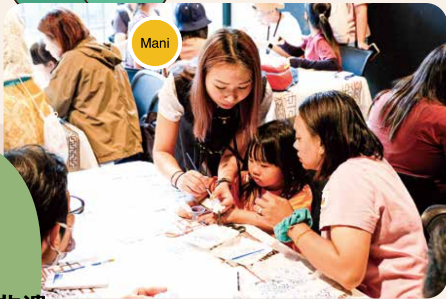
一雙大手帶着一隻小手完成作品。