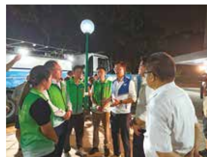
一眾義工向水務署了解食水渾濁情況。

水務署當日晚上在社交媒體公布，事發後在區內安排了五部水車及四十個水缸設立臨時取水。初步調查顯示事件懷疑因附近水管工程操作水掣，導致水壓變化揚起管內沉積礦物質所致，並強調並非瀝青。署方事後沖洗政府喉管改善，至當日深夜供水陸續回復正常。