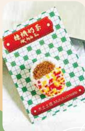
工作坊教人用俄羅斯刺繡技法，將奶茶、茶具等融入手作。