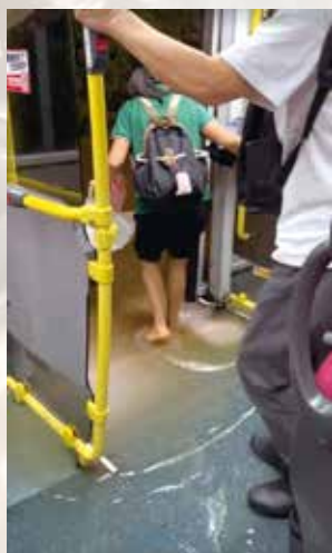
坪輦路有巴士被洪水圍困，有乘客試圖冒險下車。