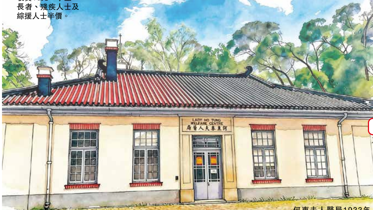
何東夫人醫局1933年落成，至今93年歷史。