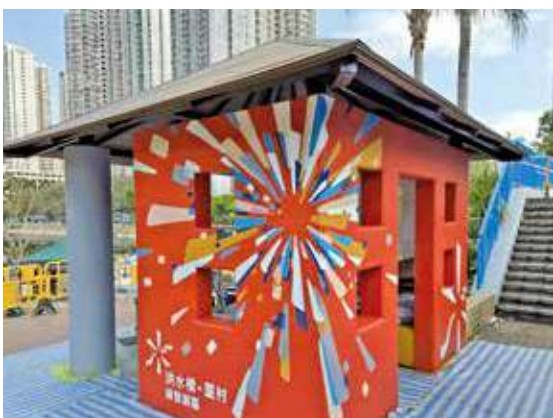
土拓署藉工程優化現有涼亭、為欄杆進行油漆翻新。