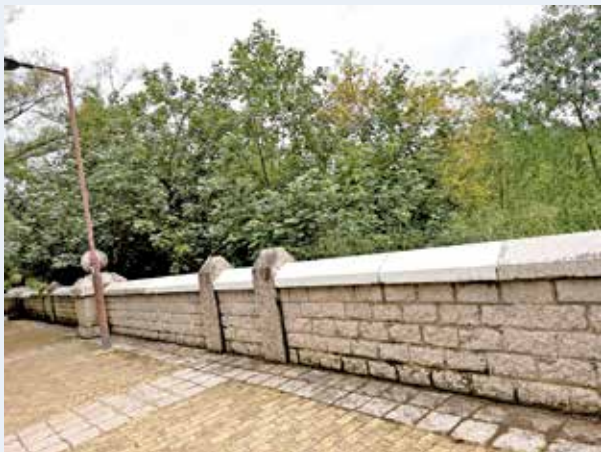
經反映後，塗鴉已被防水塗層覆蓋。