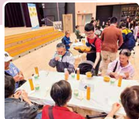
學生有條理地送餐、認真聆聽指示，並守紀律地完成崗位。