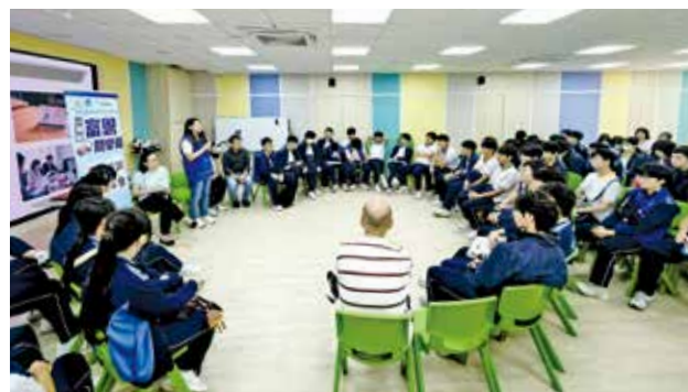
團隊聯同學校探訪長者。

愛心始於關懷，成長源於服務。元朗富恩小區關愛隊5月9日聯同天水圍香島中學攜手舉辦長者探訪服務，透過跨代互動推動社區關懷，讓年輕人走出課室、走進社區，從服務中學習理解與感恩。