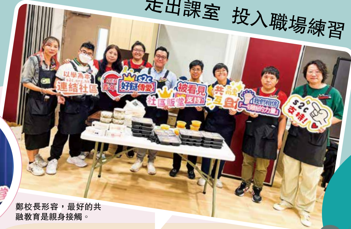
鄭校長形容，最好的共融教育是親身接觸。

鄭校長亦希望，未來學校會繼續尋找有心的社企及企業合作，除了餐飲服務，亦會探索清潔、汽車美容、縫紉等不同工種，讓學生接觸更多職業場景。對SEN學生來說，每一次走進社區，都是一次練習；每一次被接納，也是一份鼓勵。