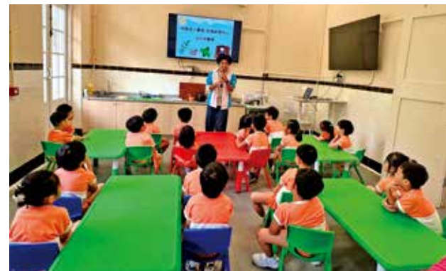
2023年醫局改為生態研習中心，為學生舉辦活動。

評級：二級歷史建築 地址：古洞古洞路38號 交通：乘九巴76K於「古洞街市」站下車，步行一分鐘即至。