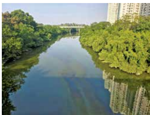
去年12月天水圍明渠接獲油污報告。

至於最近一次油污事件，發生於去年12月8日。環保署當時稱接獲市民及渠務署報告後，隨即聯同渠務署在明渠多處設置吸油物料，以控制油污擴散並進行清理，減少對生態系統的影響。當時現場水質監測結果顯示水質正常，未有魚類死亡。經調查後，懷疑油污源自一個位於元朗田廈路的非法加油站。