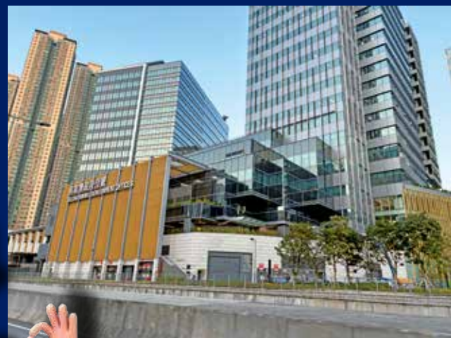
該診所位於新建的將軍澳政府合署北座。