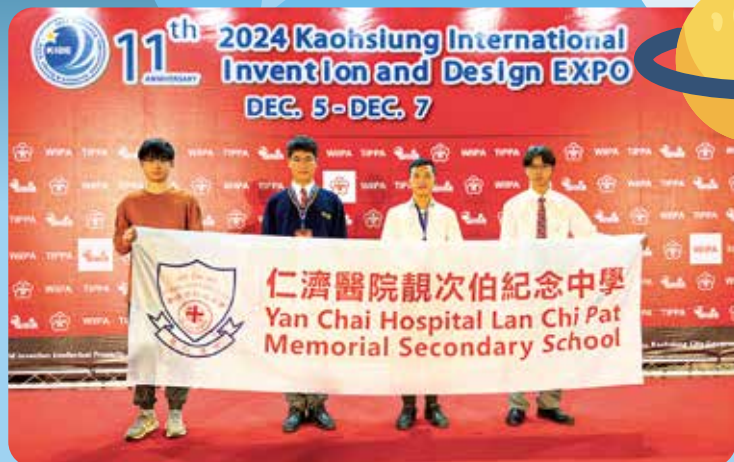
初中參加「高雄國際發明暨設計展」，獲項目銀獎。