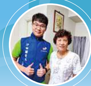
參與沙田關愛隊籌辦的「青年暑假探訪計劃」。