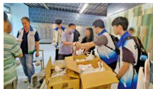
團隊前往昭明苑，向居民派發糰子。

劉啟康續指，活動旨在凝聚社區力量，弘揚傳統節日文化，同時透過派發糰子關懷區內居民，尤其是長者及基層家庭。坑口東及坑口西關愛隊亦積極協調義工分工，確保製作及派發過程順利進行。