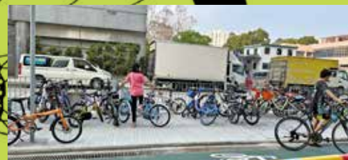
粉嶺工業邨區域有大量單車直接放在行人路的鐵欄。