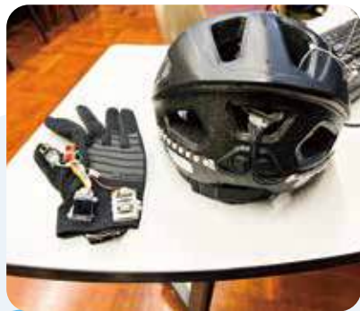
頭盔裝有LED燈，配合手套三按鈕，功能像車輛燈號一樣。

錦豐對科學和創科的興趣，最早來自他在香港就讀的第一間小學——循道衛理聯合教會天龍小學。學校重視STEAM教育，讓他從小接觸電腦科學和不同創意實作。他說，發明可以「幫助現實中一些困難」，也可以幫助真正有需要的人解決問題。