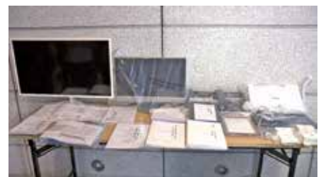
5月警方搗破一個偽基站發放詐騙訊息。(電視畫面)