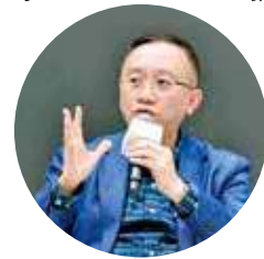
方保僑提醒，不應轉賬金錢或開啓短訊內的超連結。

針對相關情況，醫務衛生局與醫管局於6月初發出嚴正澄清指出，從未發出該類短訊，並已就事件報警處理。當局強調，醫健通和醫管局均已參與「短訊發送人登記制」，官方發出的所有短訊均會以「#」號開頭，即「#eHealth」或「#HA Go」，以便市民識別發送人身份真