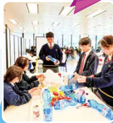
「校際執垃圾世界盃」比賽前，做好預備工夫。