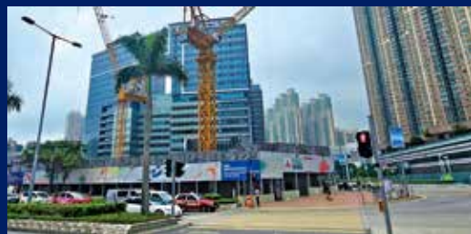
將軍澳公眾街市隨聯用綜合大樓正在興建。

食環署計劃將該街市在內的三個將落成的新公眾街市中，引入整體承租模式，換言之涵蓋將於2027至28年間竣工的將軍澳第67區、天水圍及古洞北新發展區三個新公眾街市。整體承租模式是把街市交由外判營運商管理，再由營運商分租予檔販經營，取代以往由食環署直接管理及挑選租戶的做法。新計劃將於今年第三季邀請市場提交意向書，並會率先就天水圍新公眾街市的整體承租進行招標。