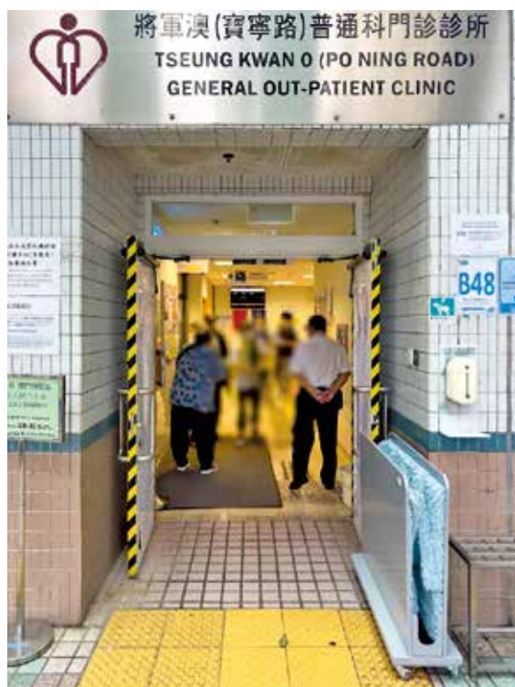
將軍澳現時只有寶寧路診所設有夜診。