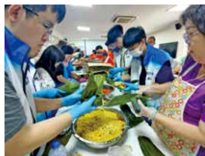
義工加入關愛隊行列，一同參與包糰活動。

剛過去的6月19日是端午節，坑口鄉事委員會於節日前舉辦「萬糰同心為公益2026」活動，吸引過百名社區義工參與。其中，包括來自青年學院邱子文分校的青年義工。他們一同製作糰子並派發予區內居民，共迎佳節。