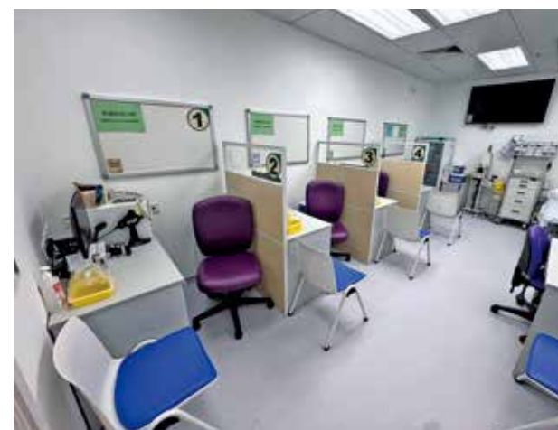
有地區人士指新診所設備較新、空間較大。