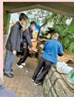
學生每星期陪伴長者推車、整理紙皮。

該校的社區服務不止於拾荒長者，亦包括長者鄰舍探訪、小學生功課輔導、長者工作坊等。蔡校長相信，學生有能力付出，也需要在真實社區中學會聆聽、忍耐和同理。一程紙皮車，推的不只是回收物，也推開了學生理解社區的一道門。