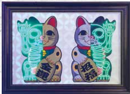
招財貓作品外表鮮明，內裡卻象徵內心光芒被遮蓋。