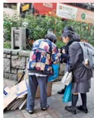
一個真摯的問候，帶來的意義往往不小。

一車紙皮看似普通，真正推上手，學生才知道重量不輕。長者每日在街上穿梭，彎身、綁繩、推車，換來的未必很多，辛酸卻真實。蔡校長說，對拾荒長者而言，最重要未必只是有人幫忙推車，而是「佢覺得有人關心佢」。學生願意停下來、走近一點，一個小小動作，已經可以帶來很大的回響。