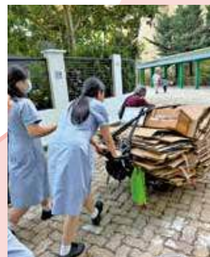
推一程紙皮車，推開理解社區的一道門。