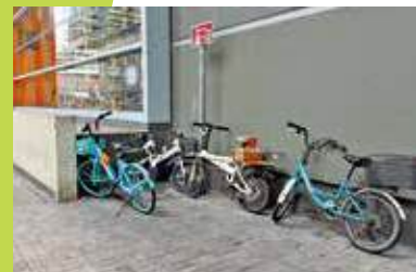
寶琳站外有單車直接放在行人路上。