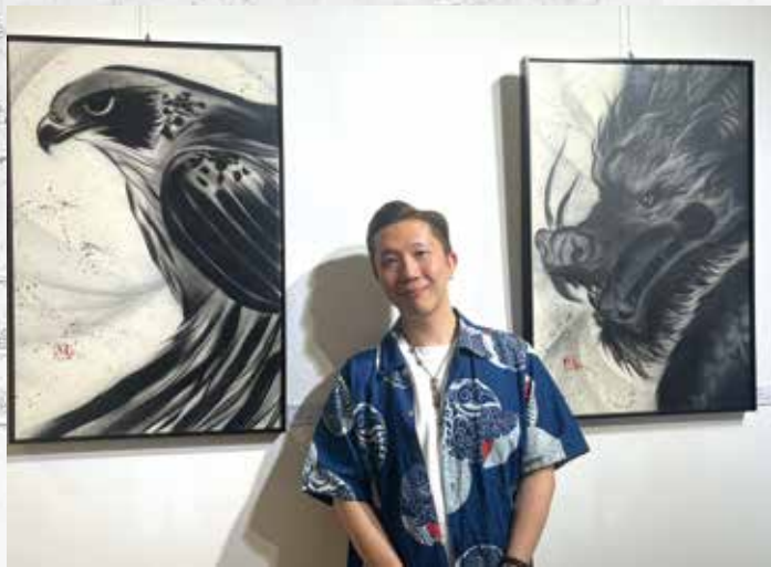
噴漆水墨系列呈現香港藝術中西交融特質。