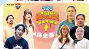
將訪問內容，整理成120個社區小確幸故事。

南豐集團「約好學院」與中華基督教會全完第一小學合作的「荃」系列第三季「荃遞」，以「120個微笑小確幸」呼應學校120周年。學生走出課室，到南豐紗廠、力生廣場、荃灣工業區及小店採訪，記錄街坊與不同社區人士的故事，並拍成短片。