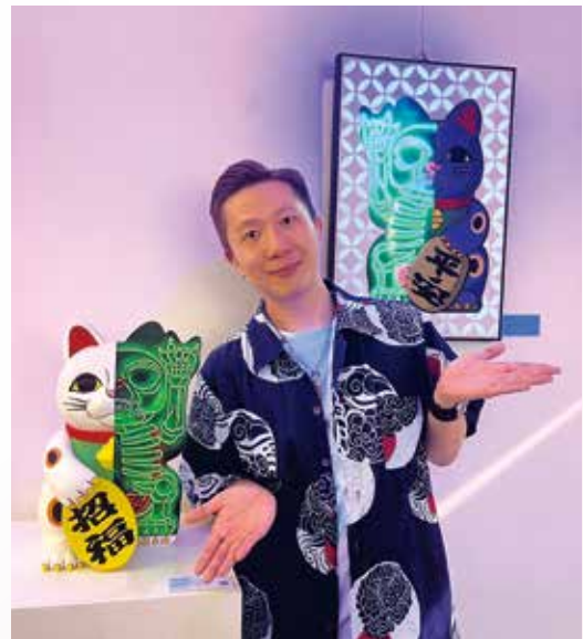
首次個人畫展《50:50 Duality》，記錄尋找生命平衡點。