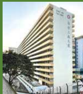
葵安工廠大廈已拆卸，用地正建公屋。

醫務衛生局在發展初期，曾計劃將葵青地區康健中心的主中心長遠選址設於該基座平台，惟局方於2024年7月表示，因葵安工廠一帶交通不便、通達性稍遜，決定撤回該選址。當局當時指將適時另覓長遠選址。現時葵青地區康健中心，位於葵昌路九龍貿易中心，相關租約將於2027年屆滿。