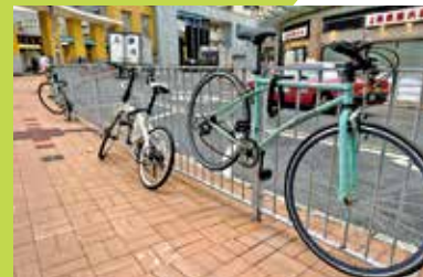
將軍澳區大量單車直接鎖在行人路鐵欄。

政府由民政事務處統籌地政總署、食環署、警務處及運輸署進行聯合清理，全港每年清理違泊單車超過2萬輛，但這種執法方式多年來被轟治標不治本，跨部門行動亦因需時太長而難有阻嚇性。黃遠康指出，根據政府文件每兩星期會有一次清理違例單車行動，但每次只是在一個區域內進行，頻密程序低，難有阻嚇性。