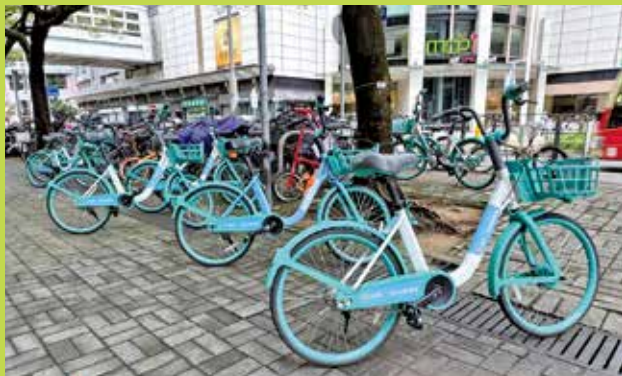
將軍澳寶琳站附近的公共單車泊位被大堆單車長期佔用，當中不少是鋪滿厚灰的「死車」。

近年本港單車徑網絡日趨完善，《我家》記者走訪將軍澳及粉嶺單車重鎮，發現行人路與天橋底隨處可見密密麻麻的違泊單車。在將軍澳寶琳站外，大量單車直接鎖在行人路的鐵欄，原本寬闊的行人路縮減大半，坐輪椅的街坊或推嬰兒車的家長寸步難行，被迫冒險與車爭路。寶琳站外附近的公共單車泊位更是被大堆單車長期佔用，當中不少是鋪滿厚灰、車身生鏽車輪洩氣的「死車」，明顯已放置多時未有移動。