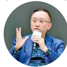
方保僑提醒，不應轉賬金錢或開啓短訊內的超連結。

然而，有蘋果手機用戶反映，因詐騙短訊以「HA Go」名字發出。手機系統或會自動將發送人名稱相同的訊息歸入同一對話框，即使電話號碼不同亦會合併顯示。由於不少市民過去曾真正接收過「HA Go」的官方短訊，騙徒只要將發送人名稱設定為「HA Go」，新收到的詐騙短訊便會與舊有的官方訊息夾雜顯示，令用戶難以分辨，誤以為全部來自可信來源。