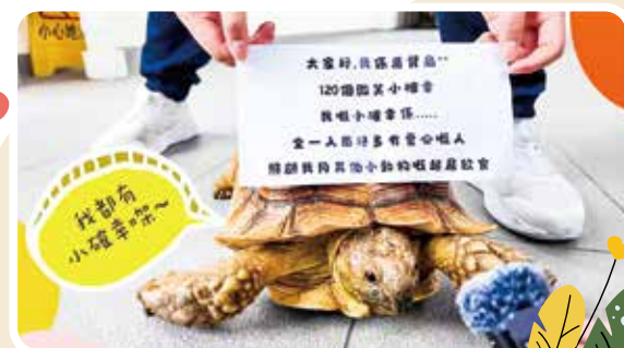
別出心裁的訪問，讓烏龜先生慢慢講感想。

訪問過程中，也有意想不到的溫暖。一位小店主初時十分緊張，甚至擔心得哭了出來，孩子反過來安慰她：「不用怕，我們會揀最好的一個take才拍，你講得舒服為止。」受訪者被孩子的體貼感動，孩子也學到，一句安慰，也可以成為別人的小確幸。