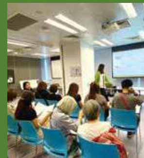
葵青地區康健中心租約於2027年屆滿。