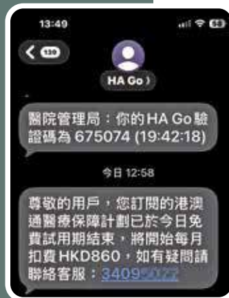
蘋果手機對話框有可能將真假短訊合併顯示。

針對相關情況，醫務衛生局與醫管局於6月初發出嚴正澄清指出，從未發出該類短訊，並已就事件報警處理。當局強調，醫健通和醫管局均已參與「短訊發送人登記制」，官方發出的所有短訊均會以「#」號開頭，即「#eHealth」或「#HA Go」，以便市民識別發送人身份真