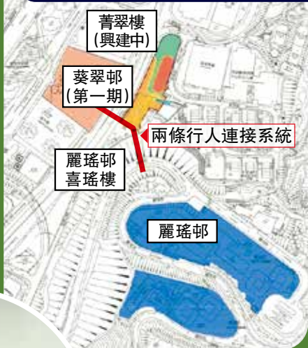
連接葵翠邨第一期的行人天橋已見雛形。