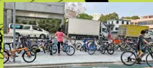
粉嶺工業邨區域有大量單車直接放在行人路的鐵欄。