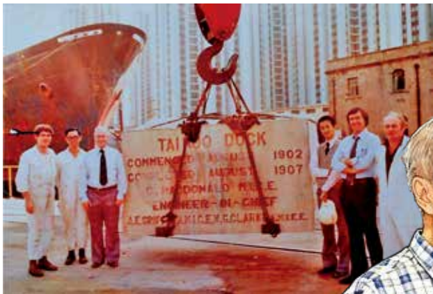
太古船塢在1978年告別的情景，紀念基石被拆卸保存。

今日的太古城，是港島東知名的私人大型住宅及商業綜合發展項目，人流絡繹不絕。然而，在太古城中心二期地下停車場入口旁，一塊看似樸素的花崗岩奠基石，卻默默承載着這片土地百多年前的工業歷史。這塊奠基石，正是1907年落成的太古船塢之歷史見證。