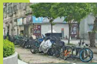
粉嶺工業邨區域的公共泊位有大量「死車」出現。