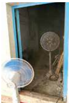
荃灣中心一期6月8日總掣房電力系統故障。

鄧又指，葵翠邨居民期待第二期街坊盡快入伙，以改善施工噪音問題。她呼籲相關部門密切監察工程對現有居民的影響，包括噪音控制及施工時間安排，並適時交代工程進度。