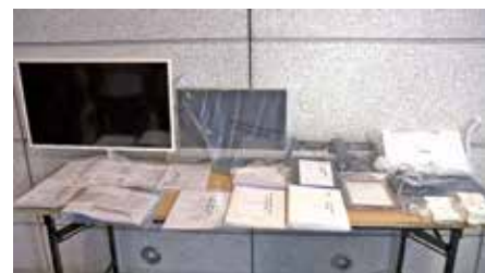
5月警方搗破一個偽基站發放詐騙訊息。(電視畫面)