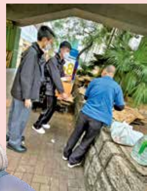
學生每星期陪伴長者推車、整理紙皮。

該校的社區服務不止於拾荒長者，亦包括長者鄰舍探訪、小學生功課輔導、長者工作坊等。蔡校長相信，學生有能力付出，也需要在真實社區中學會聆聽、忍耐和同理。一程紙皮車，推的不只是回收物，也推開了學生理解社區的一道門。