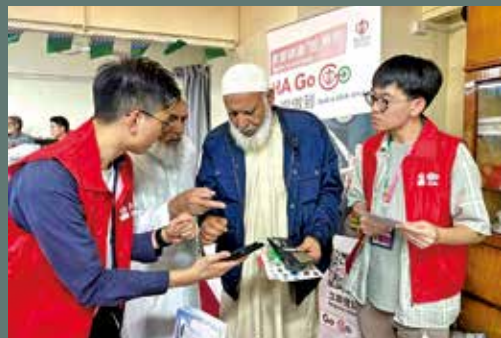
「HA Go」是醫院管理局推出的一站式手機應用程式。

近期本港出現假冒醫院管理局手機程式「HA Go」名義發出的詐騙短訊，內容指市民訂閱的醫療保障計劃試用期已結束，將會產生費用，企圖誘導市民撥打內附電話或回撥不明來電，官方澄清已報警，正規短訊有「#」號辨識，市民要加強提防。