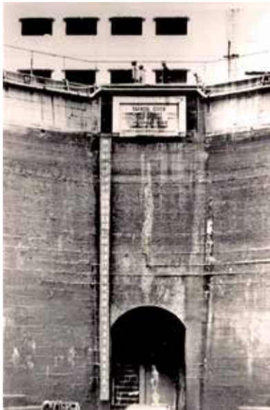
太古船塢1907年落成，奠基石在當時裝嵌在早塢盡頭外壁上。(歷史圖片)

今日的太古城，是港島東知名的私人大型住宅及商業綜合發展項目，人流絡繹不絕。然而，在太古城中心二期地下停車場入口旁，一塊看似樸素的花崗岩奠基石，卻默默承載着這片土地百多年前的工業歷史。這塊奠基石，正是1907年落成的太古船塢之歷史見證。