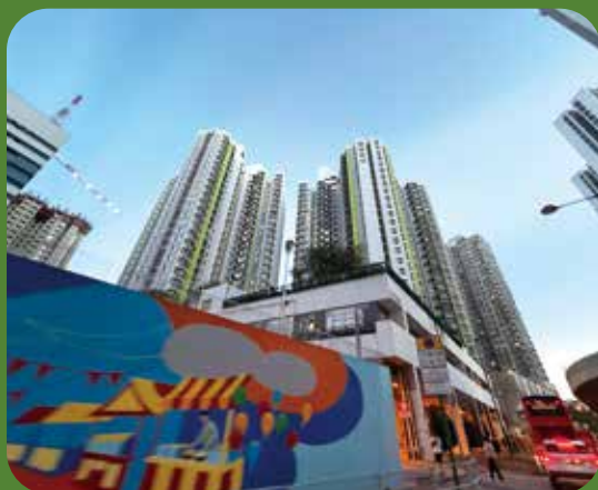
葵翠邨第一期前身是警署宿舍。