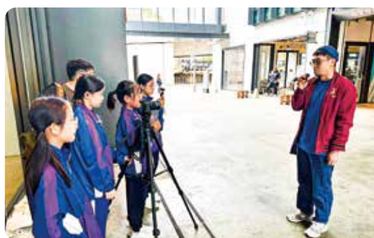
在南豐紗廠採訪，大家努力守住崗位。