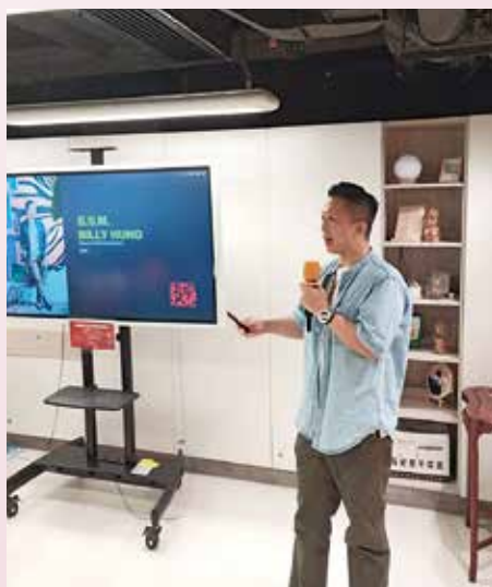
不時走進社區，帶領大眾參與壁畫創作。