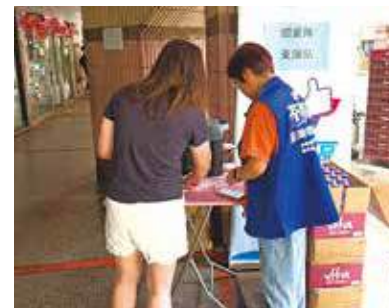
援隊於天津樓對出設立支援站。