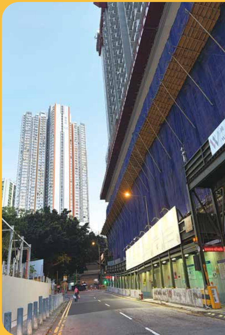
位於新葵街的菁翠樓正在興建。

位於葵涌的新葵街公營房屋項目正如火如荼興建，預計明年第一季落成。除增加近800個單位外，項目亦一併興建行人連接系統通往半山麗瑤邨。地區人士表示，居民期待項目及行人天橋、升降機塔盡快落成，認為可增加半山居民出行選擇，亦有助解決地盤施工帶來的噪音滋擾。